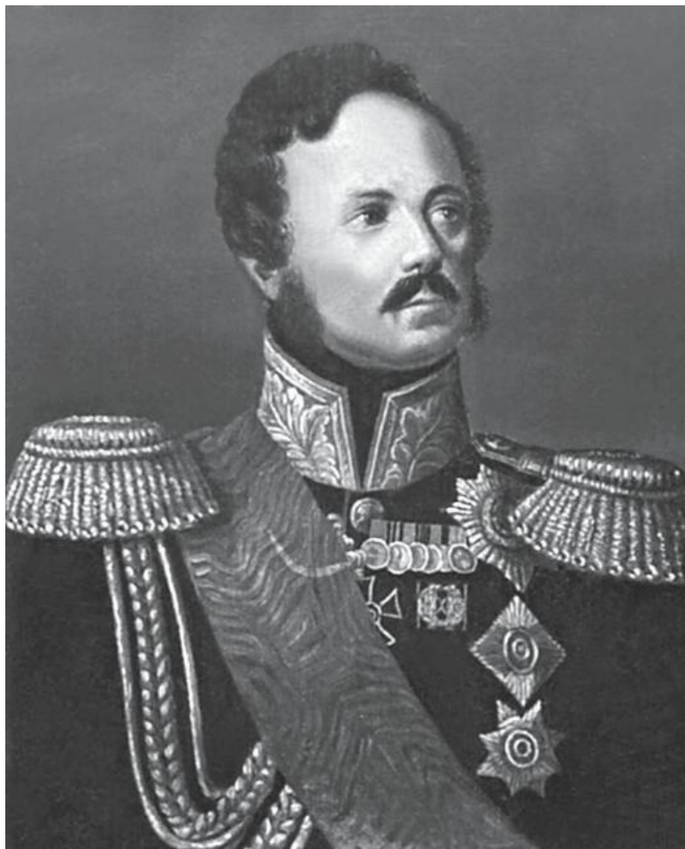
Генерал-фельдмаршал И.Ф. Паскевич (1782–1856)