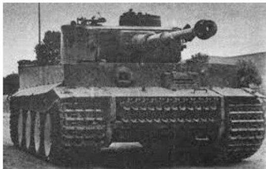
Рис. 1. Немецкий танк «Тигр».

В начале 1943 года на вооружение немецкой армии поступили с громкими названиями и усиленным бронированием средний танк «Пантера», тяжелый «Тигр» и самоходная артиллерийская установка «Фердинанд». По сравнению с предшественниками «Panzer III», «PzKpfw IV», они на дальностях до трех километров пробивали лобовую броню нашего среднего танка Т-34.