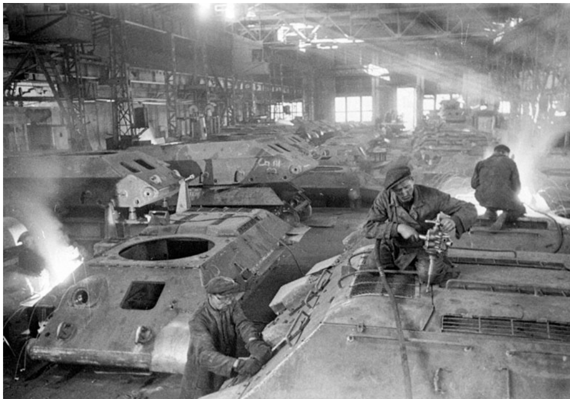
Рис. 2. Сборочный цех.

На заводе доложились военпреду. Он вызвал ведущего конструктора. С ним прошли в сборочный цех.