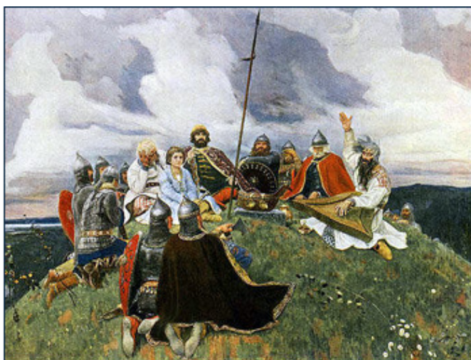
В. М. Васнецов. Баян. 1910 г.

Слово «Рафли» происходит от слов «графить», «разграфлять». Запрещение этой книги на Руси было столь категорическим, что люди не решались держать ее у себя, и в наши дни от нее остались лишь два-три разрозненных списка. Судя по статьям в русском Интернете, и наши современники остаются в полном неведении относительно этой книги, поскольку разные авторы называют ее то «астрологическим сочинением», то предшественницей арабской геомантии, то аналогом китайской «И Цзин». Разумеется, это не так.