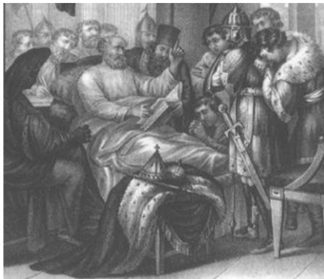
Завещание Владимира Мономаха детям.

«Ибо встретили меня послы от братьев моих на Волге и сказали: «Поспешите к нам, и выгоним Ростиславичей и волость их отнимем; если же не пойдешь с нами, то мы – сами по себе будем, а ты – сам по себе». И ответил я: «Хоть вы и гневаетесь, не могу я ни с вами пойти, ни крестоцелование преступить».