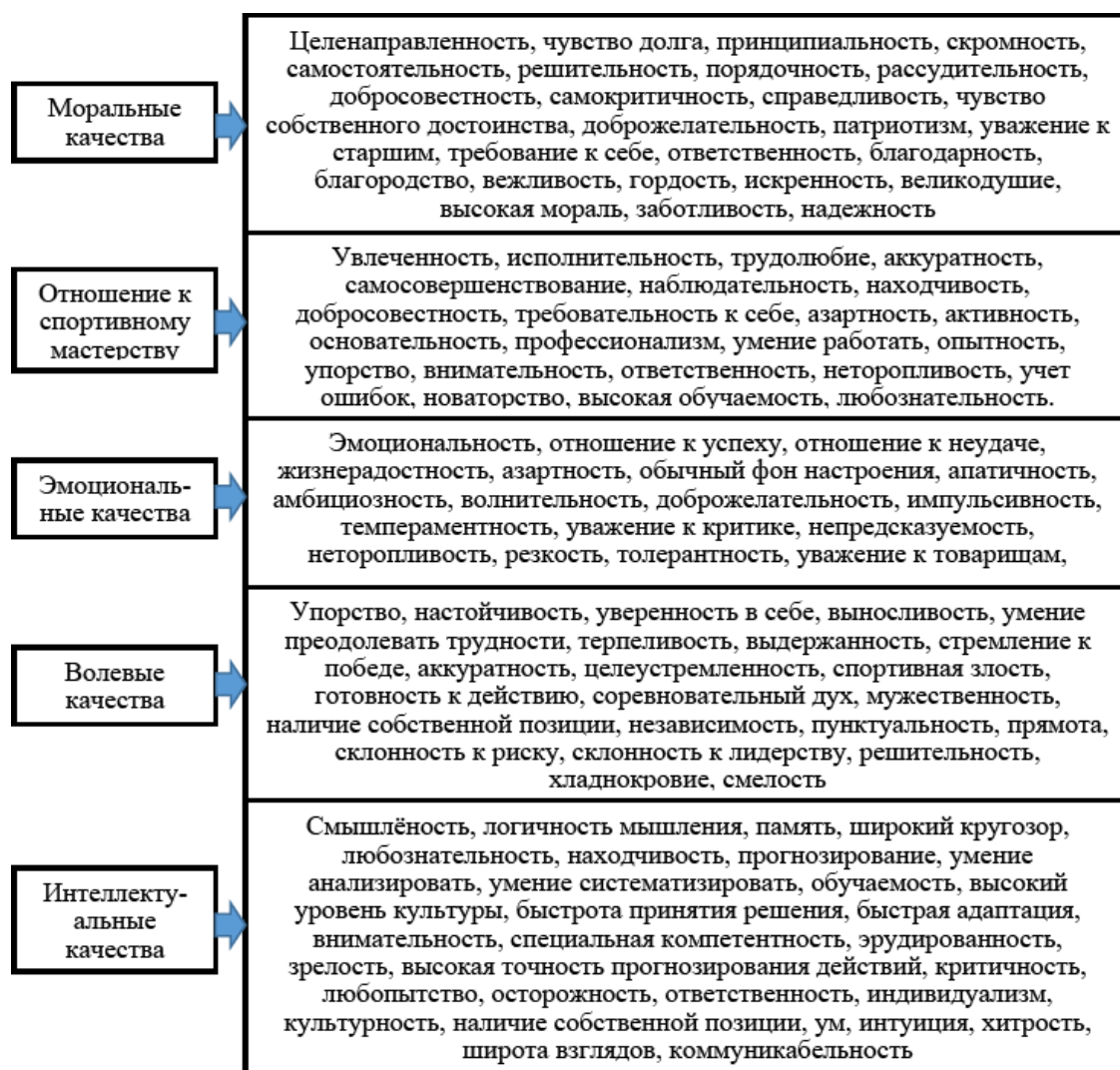
Рисунок 1.3 – Свойства и черты характера, объединяемые в качества личности, формируемые, необходимые и проявляемые спортсменом в образовательном процессе на разных уровнях развития (новичок, любитель, профессионал) (по материалам [Степанов, монография 2007 С. 53–56])

Результаты опроса квалифицированных спортсменов-единоборцев показали, что из 123 свойств и черт характера все квалифицированные спортсмены указали как на важные на 117 свойств и черт (100 %). 99,8 % – отметили как важное свойство характера «Рассудительность»; 99,7 % – «Чувство долга» и «Добросовестность»; 99,5 % – «Принципиальность»; 84 % – «Благодарность» и «Заботливость».