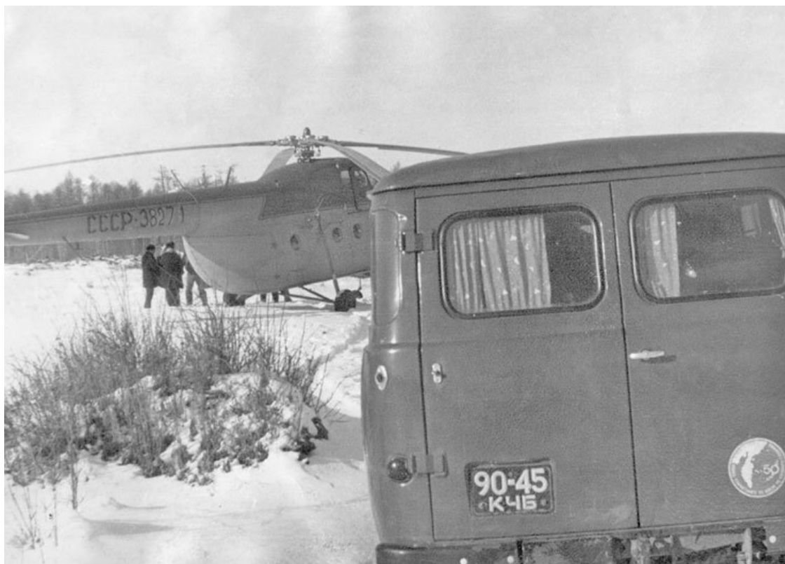
Наш «УАЗ» на вертолетной площадке. Ноябрь 1972 года