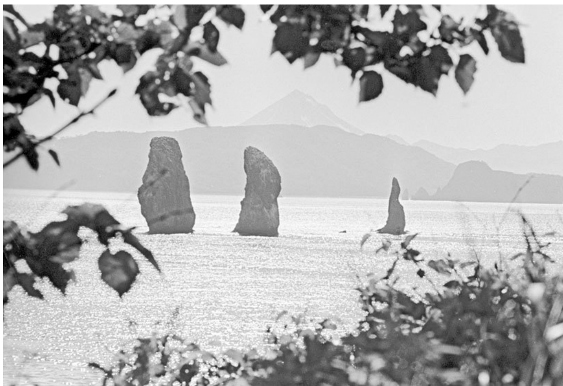
Скалы «Три брата» в Авачинской бухте у выхода в открытый океан