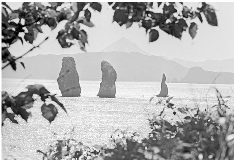
Скалы «Три брата» в Авачинской бухте у выхода в открытый океан