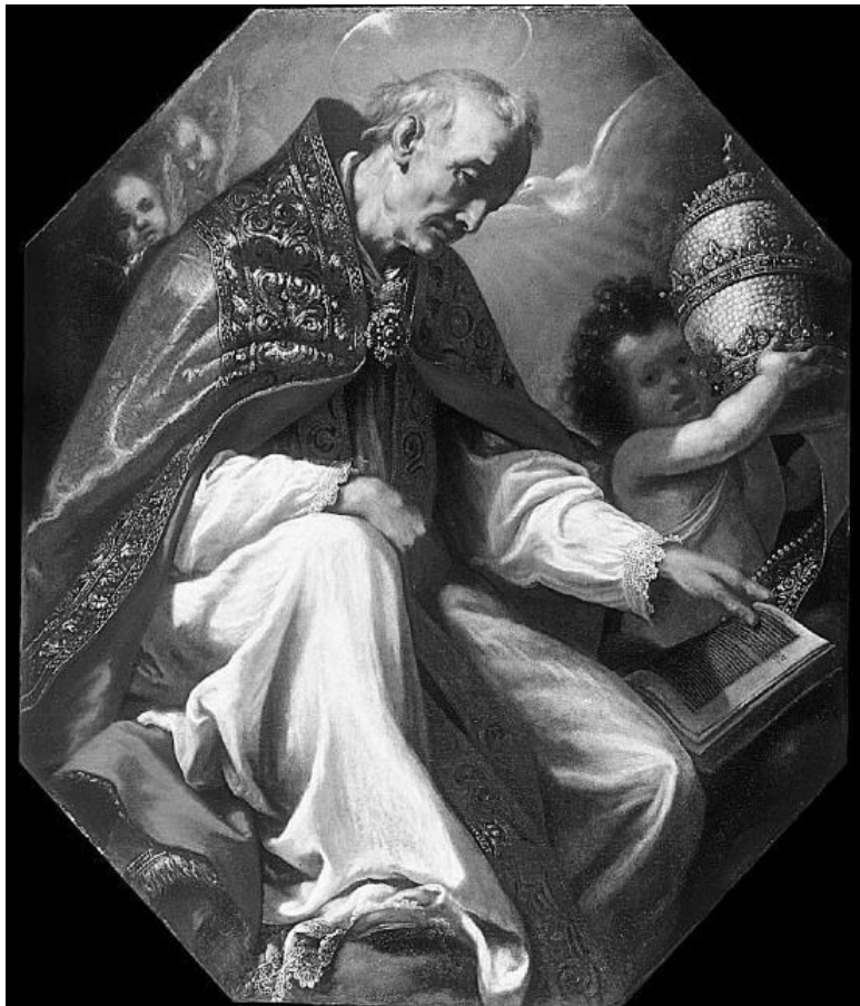
Якопо Виньяли. Св. Григорий Великий. Ок. 1630. Художественный музей Уолтерс, США