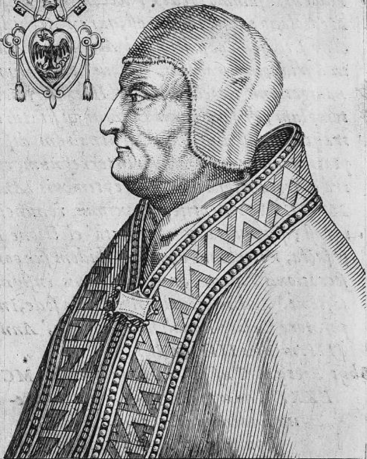
CLE ME NS, III, PAPA, NARBONENSIS Gallus