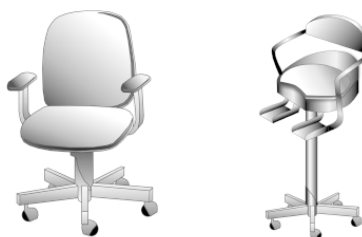
Рис. 4. Кресло, детское кресло