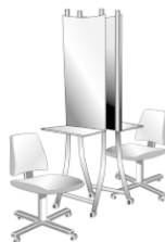
Рис. 1. Рабочее место

Рабочие места парикмахеров оборудуются креслами, туалетными столами с раковинами для мытья волос. При наличии отдельного помещения или специального места для мытья волос допускается установка туалетных столиков без раковин.