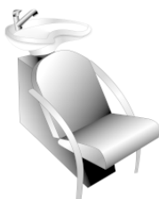
Рис. 3. Кресло с мойкой