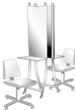
Рис. 1. Рабочее место

В мужском и женском парикмахерских залах должна быть оборудована раковина для мытья рук парикмахеров. Если в парикмахерской не более 3 рабочих мест, то допускается иметь в зале одну раковину для мытья волос и один сушуар.