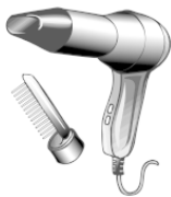
Рис. 8. Фен

Фен. Наносит ли вред волосам сушка феном? Безусловно, но иногда фен необходим. Что же касается домашней парикмахерской, то без него никак не обойтись. Для чего же нужен фен? Ошибочно мнение о том, что фен предназначен только для сушки волос после мытья. Чем естественней сушка, тем меньше вреда наносится волосам. Но иногда фен все же используется для этого. Современные насадки позволяют моделировать волосы, одновременно высушивая их. Лучше всего иметь фен с несколькими регуляторами теплого и холодного воздуха. При пользовании феном необходимо соблюдать некоторые правила.