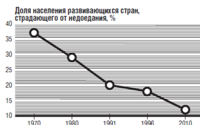
Рисунок 3. Снижение масштабов проблемы голода в мире