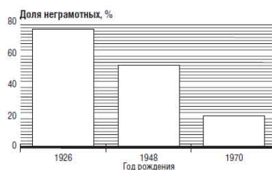
Рисунок 4. Распространение грамотности в развивающихся странах