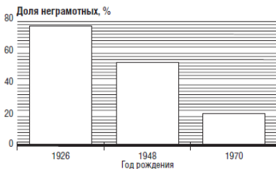
Рисунок 4. Распространение грамотности в развивающихся странах

Источник: United Nations Educational, Scientific and Cultural Organization. The World Education Report 2000. Paris: UNESCO Publishing, 2000.