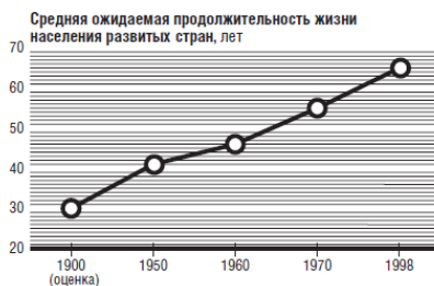
Рисунок 1. Рост средней ожидаемой продолжительности жизни