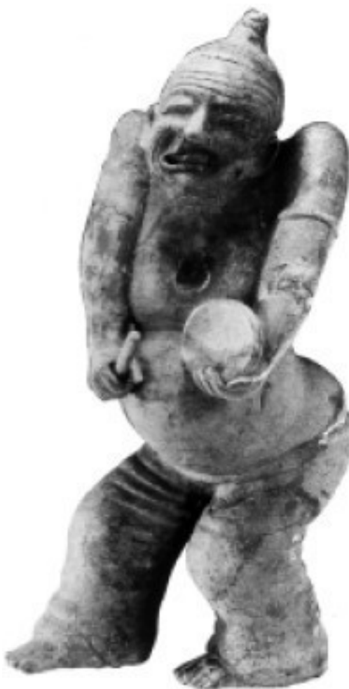
Певец и сказитель, династия Восточная Хань

Здесь родина панд, превратившихся в символ Китая и ставших лого Всемирного фонда дикой природы.