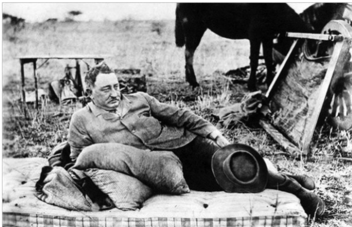
Сесил Джон Родс (5 июля 1853–26 марта 1902)

«В зимний день в феврале 1891 г. три человека вели откровенную беседу в Лондоне. Последствия этого разговора имели значение огромнейшей важности для Британской империи и мира в целом». Так начинается интереснейшее исследование «Англо-американский истеблишмент» блестящего историка Кэрола Куигли. Три человека, о которых идет речь, – три убежденных британских империалиста: Сесил Родс, журналист и разведчик Уильям Стэд (Стид) и Реджиналд Бэлиол Бретт (впоследствии – лорд Эшер, доверенное лицо сначала королевы Виктории, а затем Эдуарда VII и Георга V). Тройка собралась для обсуждения вопроса о создании тайной организации, которая должна взять на себя реальное руководство внешней (а во многом и внутренней) политикой Великобритании, укрепить Британскую империю в новых условиях (немецкий вызов), подключив к процессу укрепления США и создав нечто вроде единого англо-американского истеблишмента, господствующего над миром. Имелось в виду одновременно господство «англосаксонской расы» (доктрина расизма была детально разработана во второй половине XIX – начале XX в. именно в Великобритании, а не в Германии, позднее реализовавшей британские наработки на практике) и господство британского правящего класса с его социально-политическими и идейно-интеллектуальными традициями.