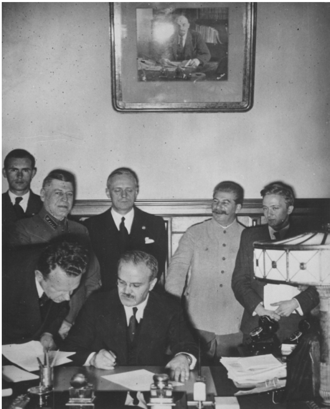
Молотов подписывает Договор о ненападении между Германией и Советским Союзом (за ним Риббентроп, справа Сталин) (23 августа 1939 г.)

Иными словами, в мае-июне 1941 г. британцы провернули тайную спец- и дипломатическую операцию, аналогичную той, что они организовали в июле 1914 г., спровоцировав Вильгельма II на войну, да так, что он, а также, естественно, Германия и немцы оказались во всем виноваты. Разумеется, формально виноват тот, кто начал войну, т. е. тот, кто капнул последнюю каплю в уже наполненную до краев чашу. Но вот что писал по поводу Первой мировой войны француз Гюстав Лебон, которого, конечно же, трудно заподозрить в симпатиях к Германии вообще и к Вильгельму II в частности. Именно Вильгельм, считал Лебон, – «автор» последней капли, но историк, подчеркивает француз, важно понять, кто наполнил чашу до