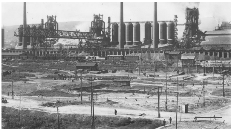
Кузнецкий меткомбинат им. И. В. Сталина в конце 30-х годов

1991 гг.) и два «водораздела» (1871–1929 г.г. и 1971–? гг.), мировое и глобальное управление этой эпохи – это прежде всего понять механизм организации войны 1914–1918 гг., цели и мотивы ее организаторов-поджигателей. Именно целостная картина эпохи, стартовавшей Франко-прусской войной (1870–1871 гг.) и экономической депрессией (1873–1896 гг.) и окончившаяся разрушением СССР (1991 г.), а не отдельные контрвыпады на упрёки в адрес СССР как стороны, якобы, несущей ответственность за Вторую мировую войну, представляется адекватным ответом психоисторическому противнику; не контратака, а контрнаступление по всей линии фронта.