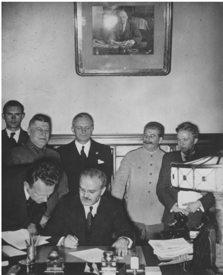
Молотов подписывает Договор о ненападении между Германией и Советским Союзом (за ним Риббентроп, справа