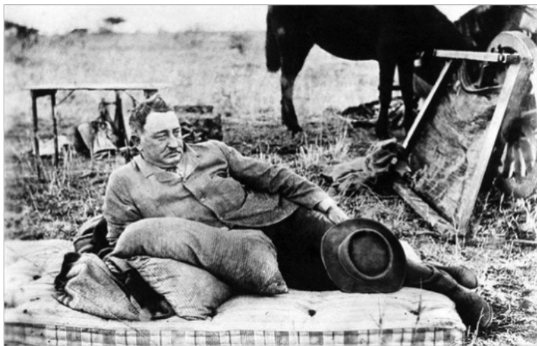
Сесил Джон Родс (5 июля 1853–26 марта 1902)

субъекта не просто наднационального европейского, а уже мирового управления выступил Сесил Родс, за которым стояли Ротшильды.