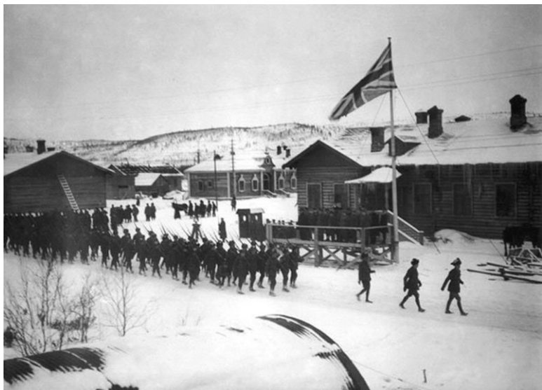
Парад англичан в Мурманске (Россия, ноябрь 1918 г.)

Разрушение СССР как формы исторической России должно было решить для Запада ряд проблем и настежь распахнуть «ворота» глобализации. То есть достичь одного из тех главных результатов, ради которых затевалась Первая мировая война, ради которых (ее) заговорщики и поджигатели работали в течение нескольких десятилетий. Именно в этой войне родился XX век. По сути же она стала началом Большой войны XX в., «горячая» мировая фаза которой длилась 31 год (1914–1945 гг.), а «холодная» глобальная – 45 лет (1944–1989 гг.). Понять «короткий XX век» (1914–