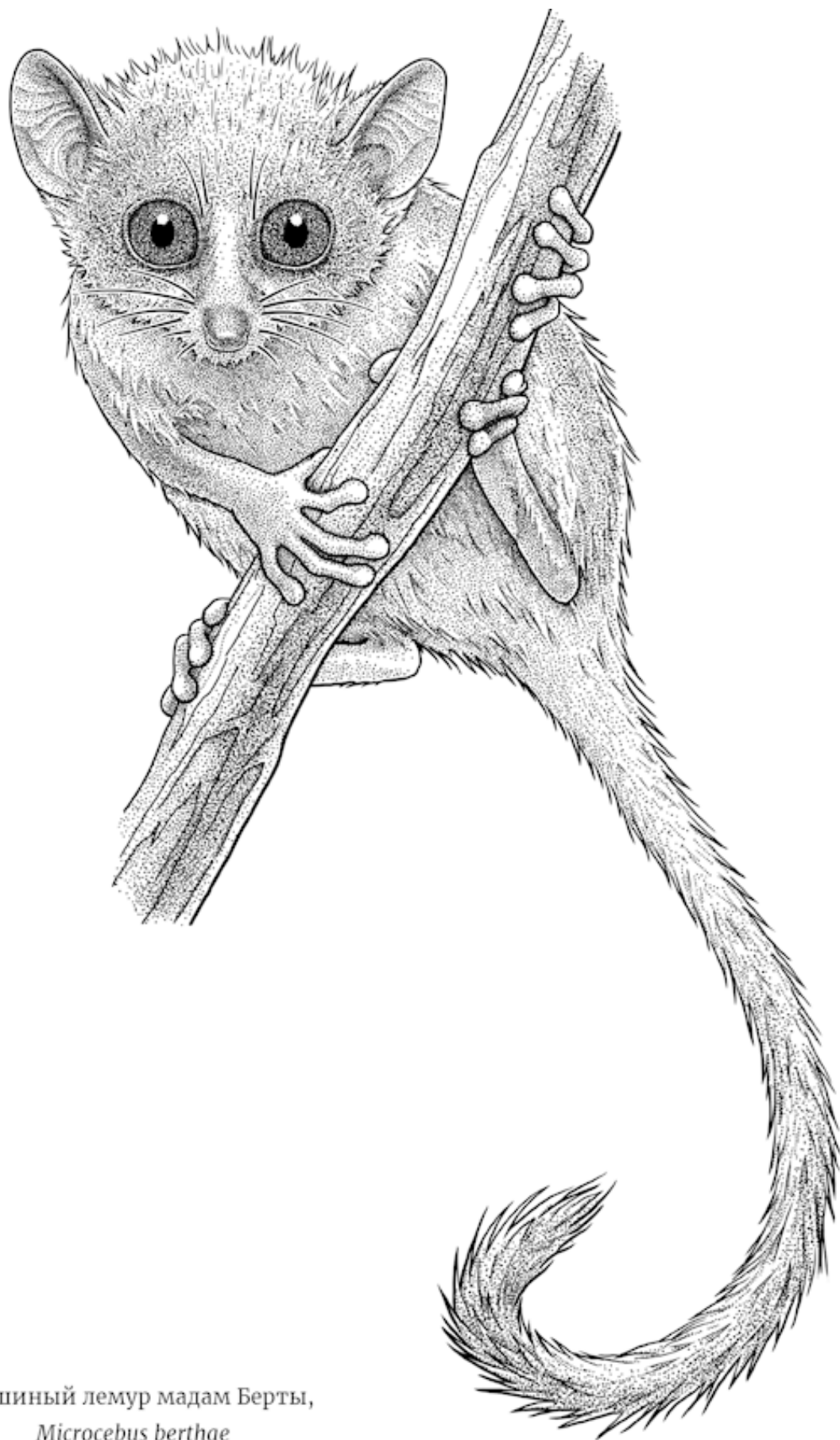
Мышиный лемур мадам Берты, Microcebus berthae