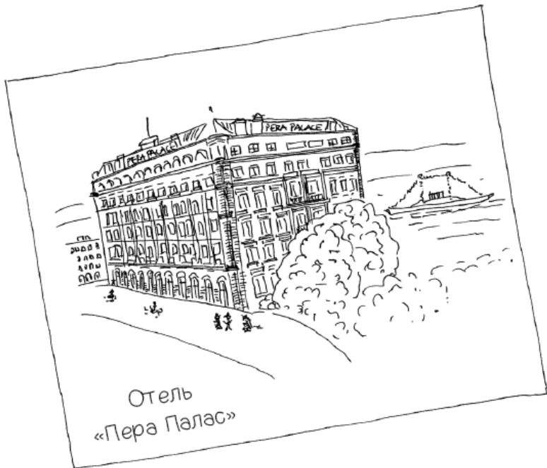
Отель «Пера Палас»