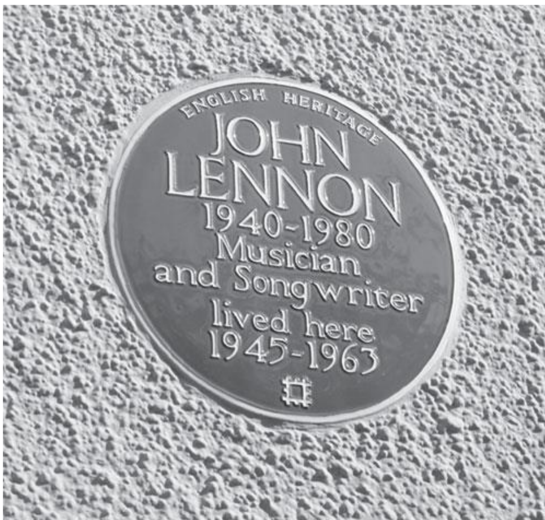
ДЖОН ЛЕННОН 1940–1980 Музыкант и поэт-песенник жил здесь

Он указал на табличку на переднем фасаде: