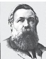
К. Маркс и Ф. Энгельс