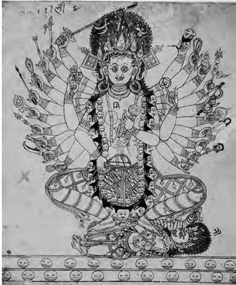
Тантрическая форма индуистской богини Кали. Непал, XVII в.