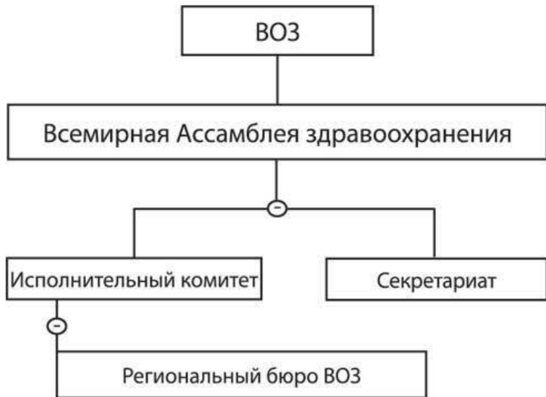
Рис. 2. Структура ВОЗ

Всемирная ассамблея здравоохранения собирается на ежегодные сессии, которые проводятся, как правило, в мае в Женеве во Дворце Наций ООН. Положения и статус Ассамблеи закреплены в пятой главе Устава ВОЗ.