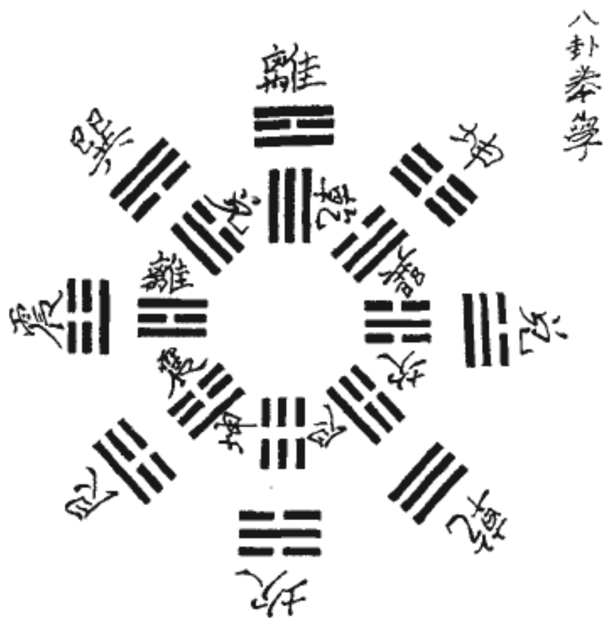
Совмещенная схема Сянь-Тянь Ба-Гуа и Хоу-Тянь Ба-Гуа (рисунок из книги Сунь Лутана «Ба-Гуа Цюань Сюэ»)