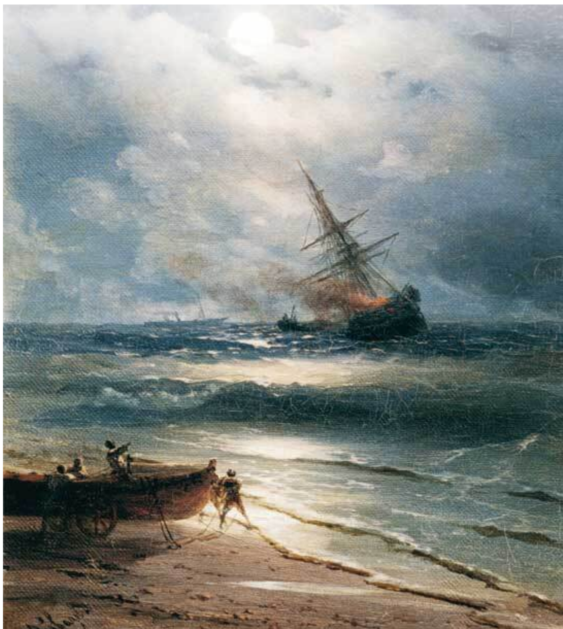
И. Айвазовский. Пожар на корабле