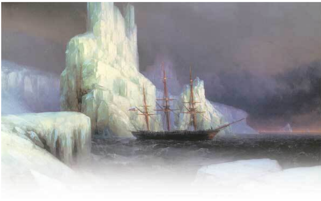
И. Айвазовский. Ледяные горы в Антарктиде

Теперь «Партизан» спешил больше прежнего и всё-таки не успел: льды окружили его со всех сторон.