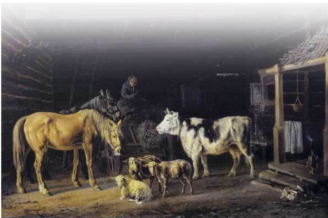
П. Ковалевский. В хлеву

Напился Алёшка, захотелось ему по двору пробежаться. Только он побежал, вдруг из будки выскочил щенок – и ну лаять на Алёшку. Испугался Алёшка: это, верно, страшный зверь, коли так лает громко. И бросился бежать.