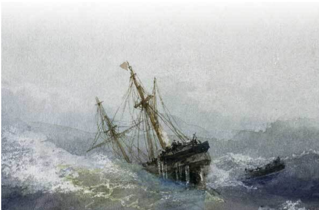
И. Айвазовский. Кораблекрушение

Эти коробки называют минами. Чтобы мины никуда не уносило, и чтобы они стояли около берега в воде, их привязывают проволоочной верёвкой к тяжёлым якорям. Якоря крепко лежат на дне и держат мины. Чтобы их сверху не было видно, проволоочную верёвку делают покороче, так что мина сидит под водой, но не очень глубоко. Пароход над ней не пройдёт, непременно дном зацепит. Когда воевали, много военных кораблей насккивало на мины. Мины взрывались и топили корабли.