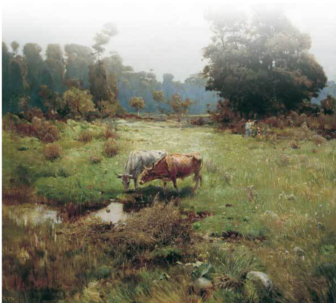
С. Васильковский. Казачья левада

Не спит только ветер ночной. Он в траве шуршит и в кустах шелестит.