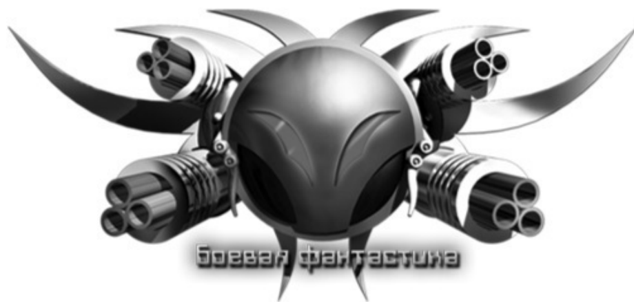
Иллюстрация на обложке Бориса Аджиева