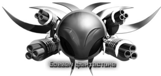
Иллюстрация на обложке Бориса Аджиева