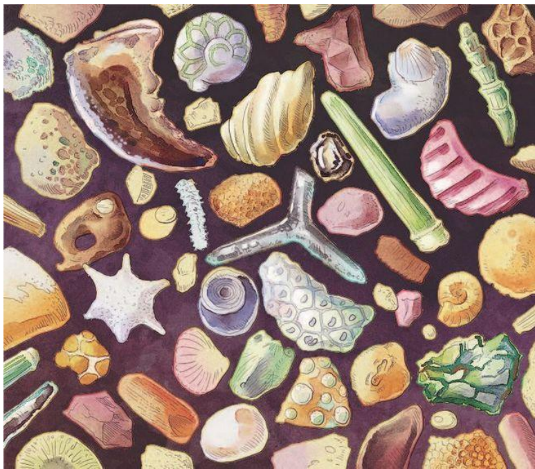
Рис. 1. Морской песок под микроскопом, 300-кратное увеличение

Посмотри на песок на берегу моря: песчинки кажутся очень похожими. Но вот тот же песок под микроскопом (рис. 1).