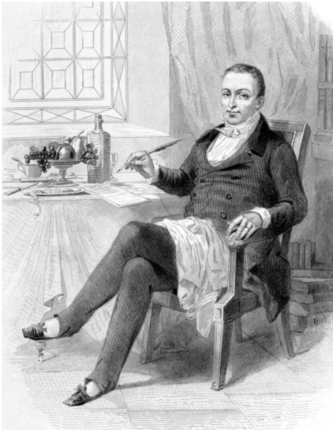
Шарль-Мишель Жофруа. Жан Антельм Брийя-Саварен. Литография. 1848