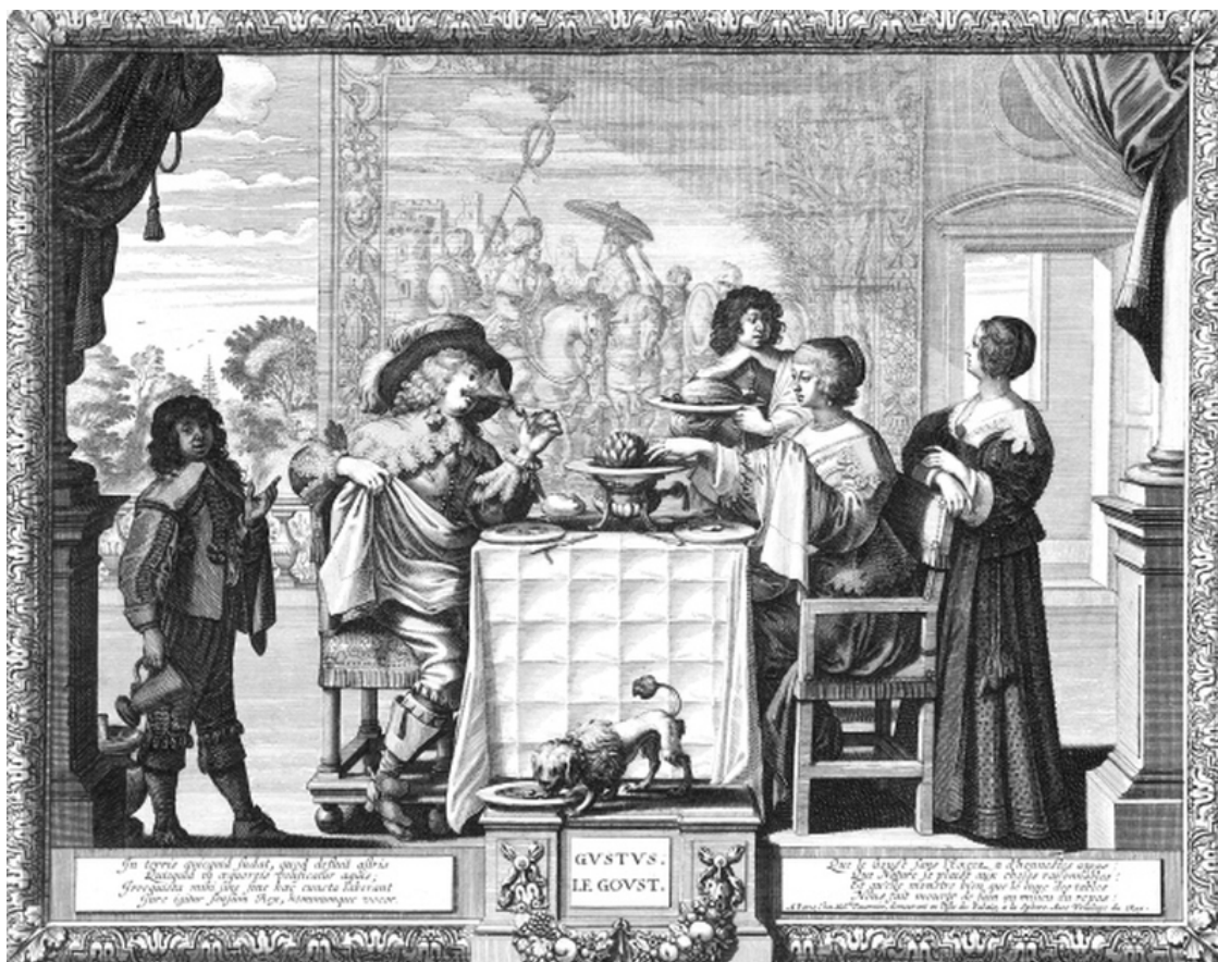
Абрахам Босс. Аллегория вкуса. Гравюра из серии «Пять чувств». 1635–1638

Так что отведем половому влечению должное место среди чувств, в коем ему невозможно отказать, а заботу определить его ранг возложим на наших потомков.