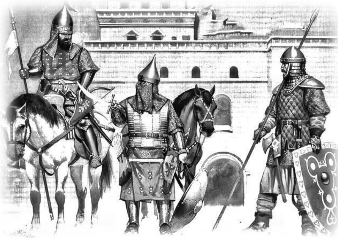
Русские воины XVI века

Василий III 20 лет прожил со своей женой Соломонией из боярского рода Сабуровых. Но оказалось, что она не может родить детей. В наше время обратились бы к врачам, а тогда подобные болезни лечить не умели. А если великий князь умрёт бездетным, престол достанется его брату. Встревожился митрополит Даниил. Представил, что случится, если государем станет Юрий. Он и с Сигизмундом уже связывался, и с заговорщиками. Будет переделывать Россию, как хочется боярам. Заведёт дружбу с поляками, католиками, согласится принять унию. Священники докладывали митрополиту и о том, что некоторые бояре связаны с сектантами. С их стороны Церкви тоже грозила опасность. Начнётся такая же буча, как в Европе, где протестанты взялись переделывать веру.