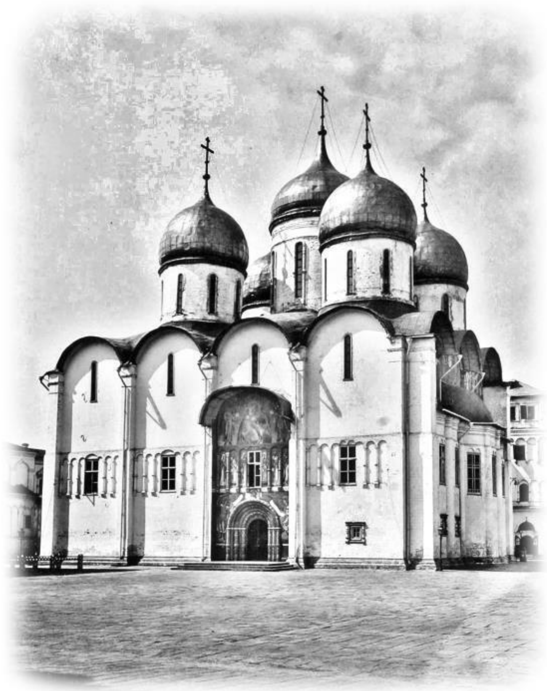
Успенский Собор Кремля