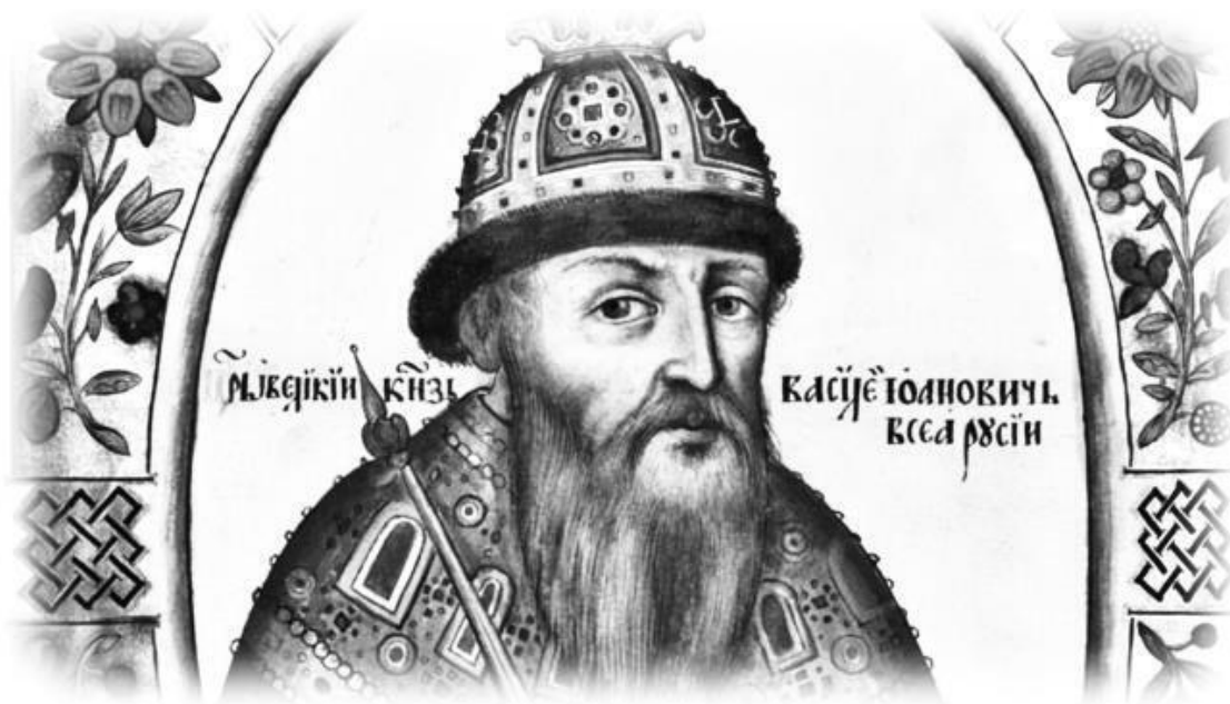
Василий III, отец Ивана Грозного

Иностранные учения, разрушавшие христианство, проникли и в Россию. Новгород был очень богатым торговым городом. Стоял возле границы, сюда приезжало много чужеземных купцов. Здешние бояре увлекались европейскими модами и обычаями. Хотели жить, как в Европе. В Новгороде появились проповедники, учившие заниматься магией, искать «тайную мудрость». Многим местным богачам это показалось новым, интересным. Да и жить так получалось удобнее. Ведь православие устанавливает посты, когда нельзя есть мясное, молочное. Устанавливает всякие запреты – нельзя воровать, лгать, развратничать. А если не верить по-православному, то ничего этого можно не соблюдать! Из Новгорода ересь (то есть ложная, неправильная вера) попала и в Москву.