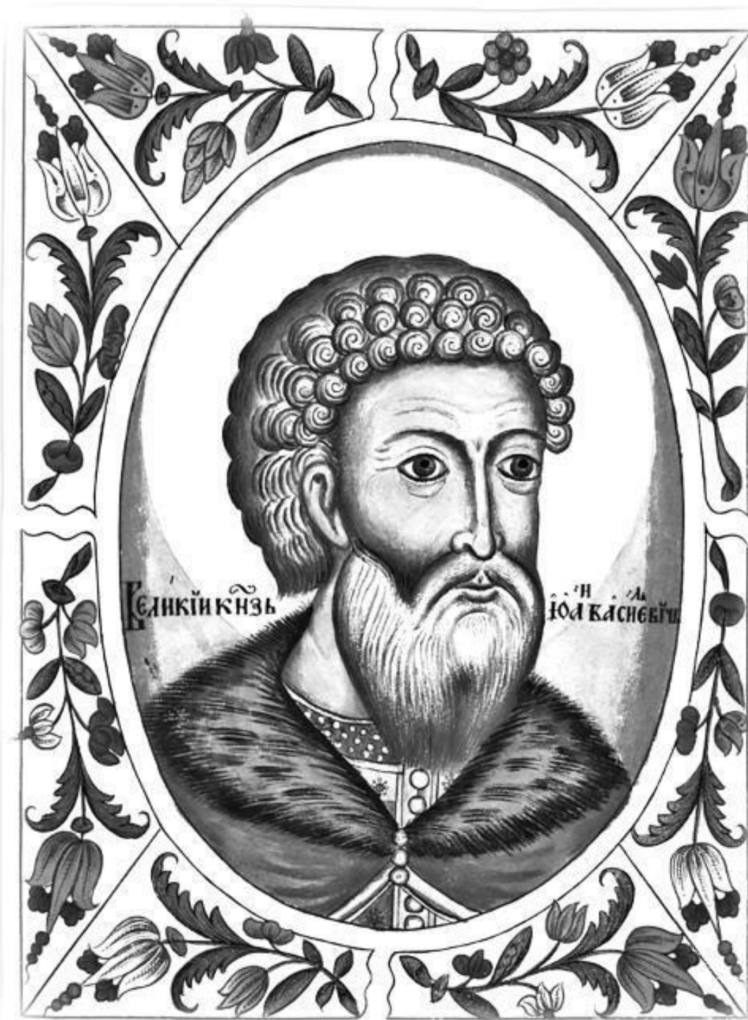
Иван III, дед Ивана Грозного. Портрет из «Царского титулярника»;