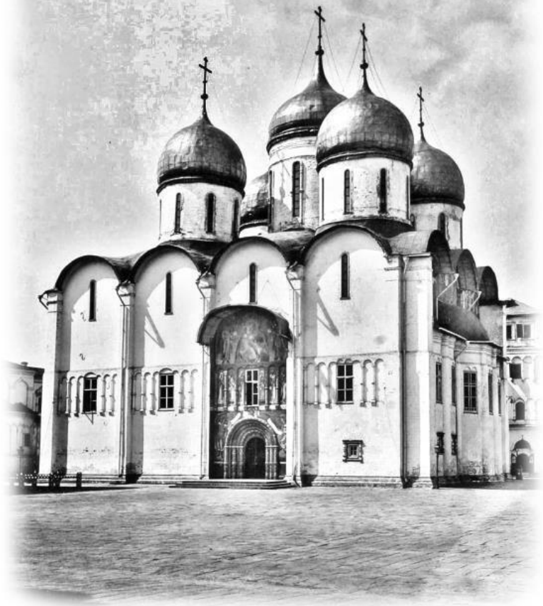
Успенский Собор Кремля