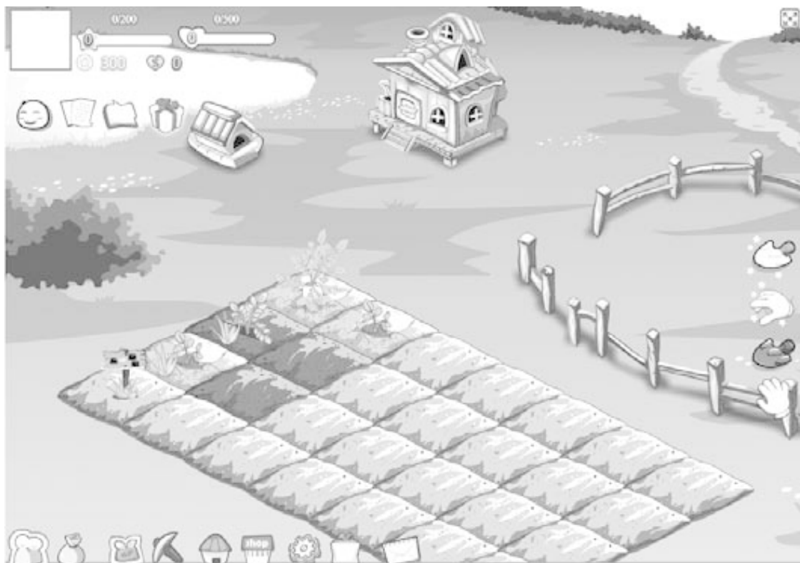
Рис. 2. Игра «Счастливый фермер»