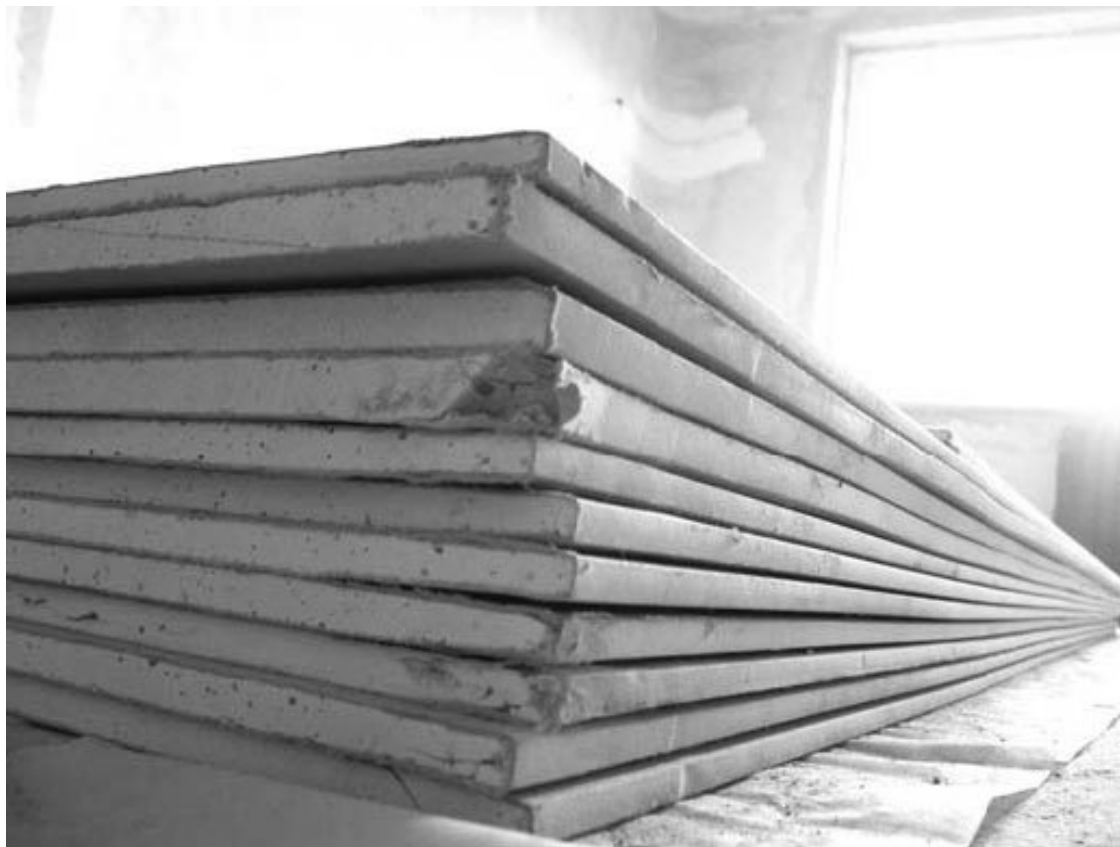
Рис. 1.1. Гипсокартон

На рынке представлен гипсокартон разных производителей (рис. 1.1). При выборе материала необходимо руководствоваться технологическими аспектами покупки, целями, стоящими перед нами, а также принципом «цена – качество».