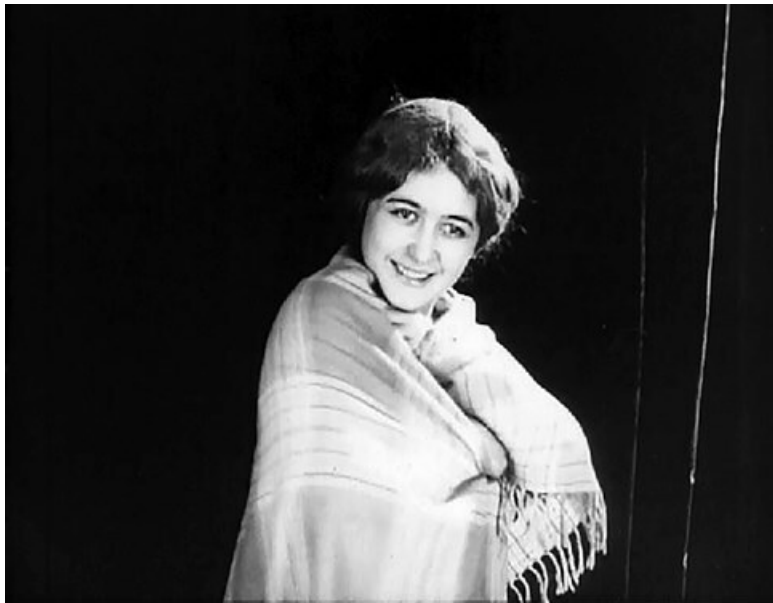
Кадры из фильма «Немые свидетели»

Прямой показ эротики на экране избегается (поцелуи и объятия инсценируются, как в балете).