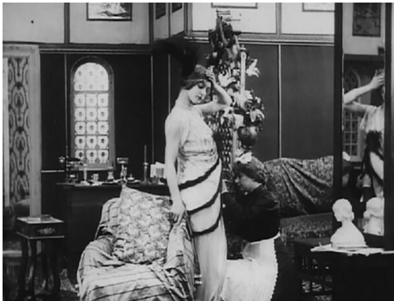
Кадр из фильма «Немые свидетели». 1914

осанку разрабатывают и фильмы начала века, передавая за- крепленные клише. В «Немых свидетелях» Евгения Бауэра (1914) сталкиваются два класса: аристократы (молодой ба- рин, его мать, его невеста, любовник невесты) и прислуга (горничная – временная любовница барина, ее жених, швей- цар – ее дед, их родственники из деревни).