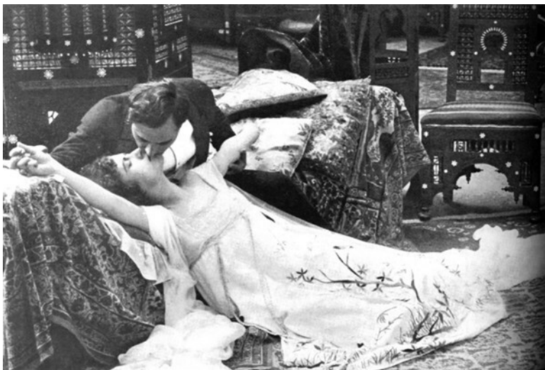
Франческа Бертини в фильме «Федора». Поцелуй в стиле танго

Эротика также связана с едой, и обе техники – наиболее важные характеристики гротескного карнавального «низкого» тела. Не случайно сцена в ресторане часто предшествует соблазнению, а глоток вина – поцелую. Но при обрисовке благородных героев режиссеры избегают показывать, как те едят. Жевание, чавканье, питье – физиологические характеристики – используются чаще всего для обрисовки простонародных или вульгарных персонажей (соблазняемой прислуги, комических двойников героя). Деревенский родственник, которого потчуют в господском доме на кухне, харка-