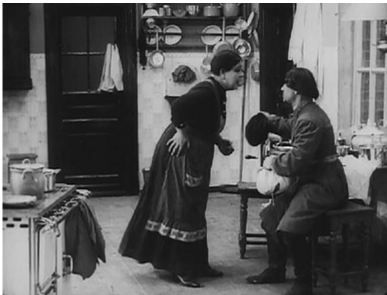
Кадр из фильма «Немые свидетели». 1914

Нельзя допустить, чтобы актер воспроизводил подражательно упоминаемые в тексте движения – рубка дерева, стрельба из лука, битье палкой, копание земли, бросание мяча 131 . Некрасиво потирать руки, обтирать их, рассматривать, чистить ногти, чесать голову или какую-либо другую часть тела. Нельзя делать жесты одной левой рукой, грубо хлопать обращенными друг к другу ладонями или повторять один и тот же жест. Щелканье большим и средним пальцами для