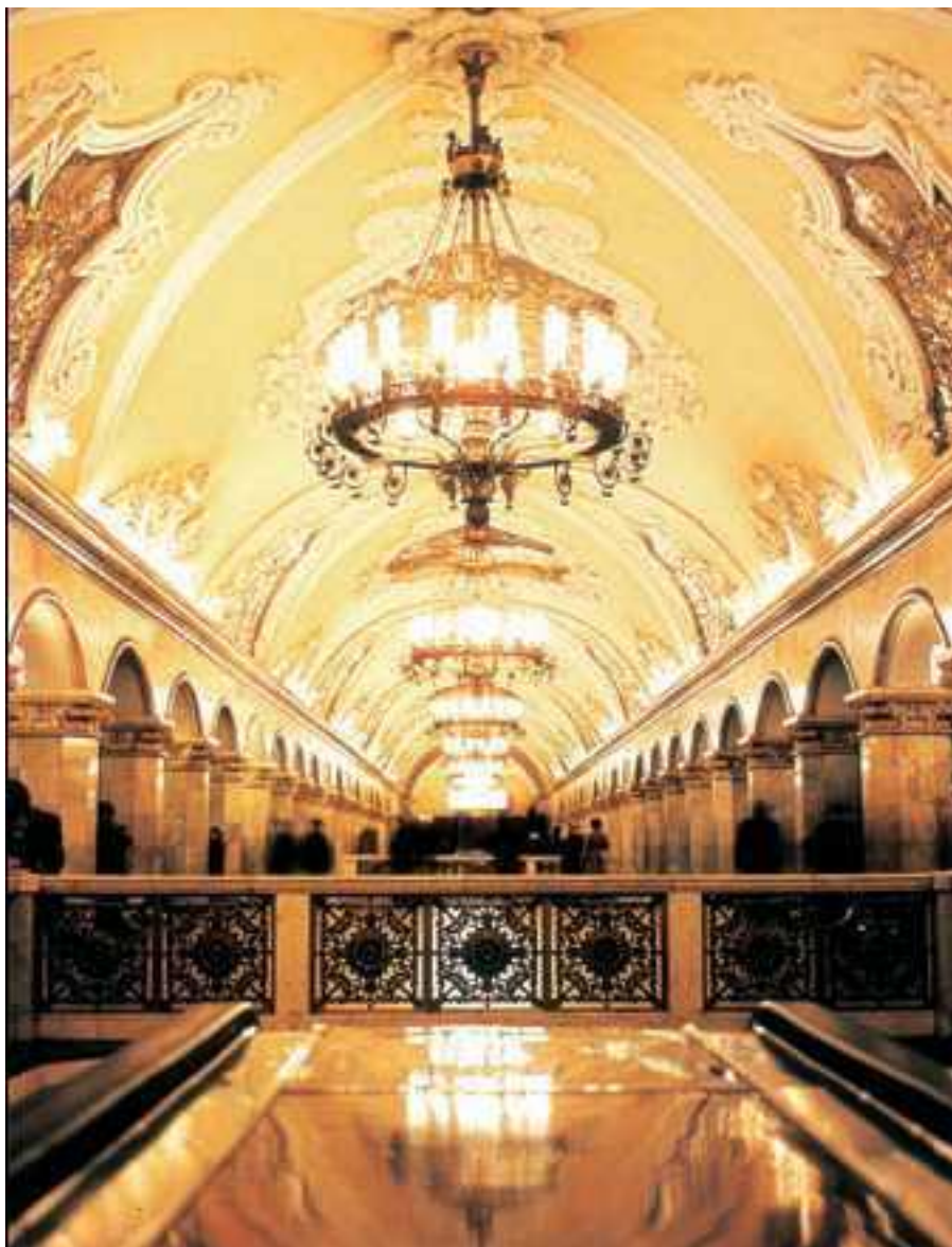
Станция метро «Комсомольская» (кольцевая). Москва

МЕТРОПО́ЛИЯ , древнегреческие города (полисы), имевшие колонии. Метрополия не имела власти над колониями, хотя покровительствовала им и в их спорах играла роль третейского судьи. В эпоху колониальных захватов термин «метрополия» стал применяться к государствам, владеющим колониями (обычно заморскими). Политико-правовые формы связей метрополии с колониями могут быть различными (протекторат, вассалитет, подопечная тер. и т. д.), но по существу это всегда отношения господства, подчинения и эксплуатации метрополией этих территорий.