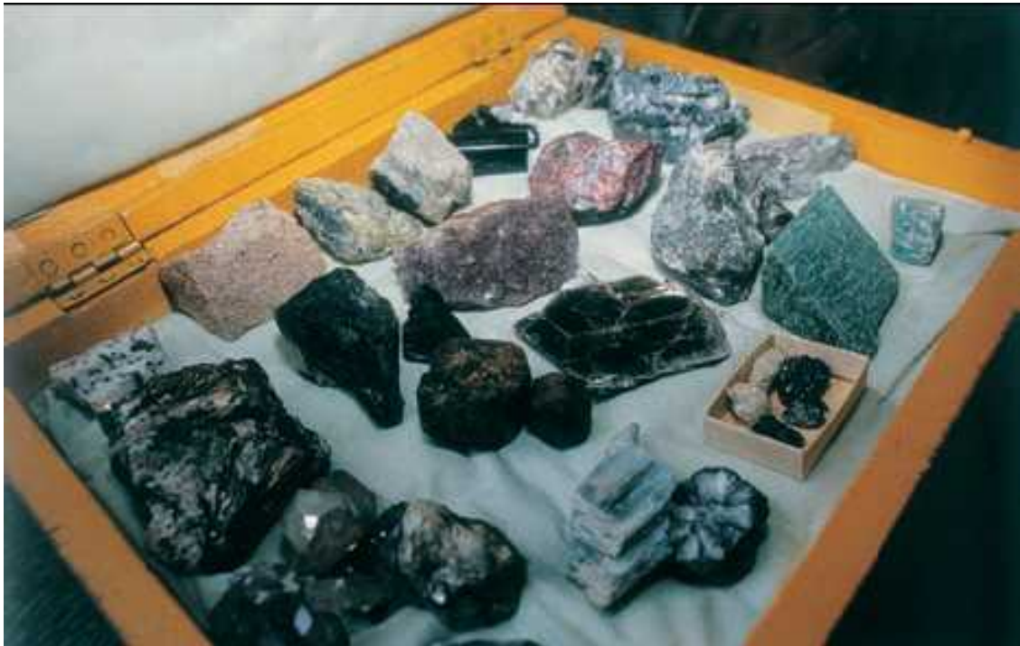
Природные минералы Заполярья

МИНЕРА́Л , твёрдое природное тело, однородное по химическому составу, кристаллической структуре и физическим свойствам, которое образуется в результате физико-химических процессов на поверхности или в глубинах Земли либо других космических тел. Составная часть горных пород. Известно ок. 2500 минералов. Наиболее распространены силикаты – ок. 25 % от общего числа; оксиды и гидроксиды – ок. 12 %; сульфиды – ок. 13 %; фосфаты, арсенаты – ок. 18 %. Земная кора на 92 % сложена силикатами, оксидами и гидроксидами.