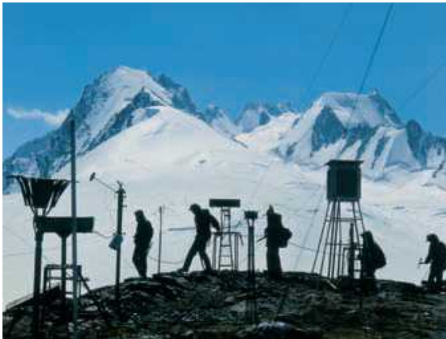
Метеорологическая станция в горах Памира

торые станции имеют дополнительную специализацию со своей программой измерений (напр., аэрологические, запускающие радиозонды для измерений в толще тропосферы; актинометрические, измеряющие потоки солнечной и земной радиации; агрометеорологические с комплексом измерений для сельскохозяйственных целей и т. д.). Во многих странах, помимо регулярной сети метеорологических станций, имеются специализированные станции, принадлежащие отдельным ведомствам (напр., при аэропортах и т. д.).