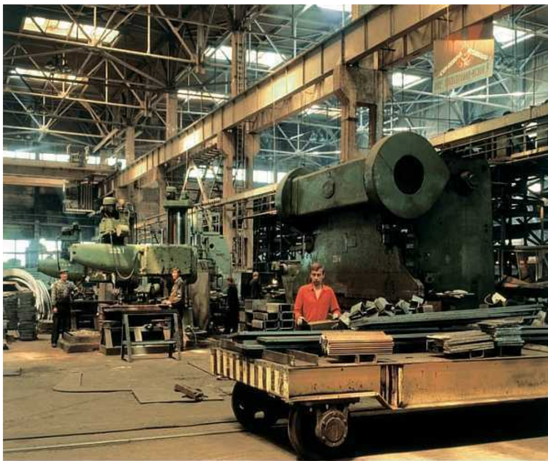
В цехе машиностроительного завода

МВÉРУ , озеро в Африке, на границе Демократической Республики Конго и Замбии. Расположено на выс. 917 м над у. м. Пл. 4920 км 2 , дл. 122 км, ср. шир. 50 км, наибольшая глуб. 15 м. Входит в бас. р. Конго. Занимает неглубокую тектоническую впадину. Берега большей частью плоские, за исключением скалистого зап. берега. В юж. части заливы и о-ва (Кильва, Сокве). На Ю.-З. примыкают обширные болота Бангвеулу. С Ю. впадает р. Луапула, вытекает на С. р. Лувуа. Сезонные изменения уровня 5 м. Рыболовство. Судходство. Гл. пристани: Кильва, Пвето (Конго).