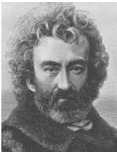
Н. Н. Миклухо-Маклай

МИКЛУХО-МАКЛАЙ Николай Николаевич (1846–1888), русский путешественник, географ и этнограф, исследователь Новой Гвинеи. В 24-летнем возрасте отправился из Кронштадта на военном корвете «Витязь» и в сентябре 1871 г. в одиночестве высадился на северо-вост. берегу острова, который впоследствии получил название Берег Маклая. До 1884 г. было 5 посещений этого и др. берегов Новой Гвинеи, во время которых учёный детальнейшим образом изучил быт и нравы туземцев, вёл среди них просветительскую работу, неоднократно выступал в качестве миротворца, доказал, что местные жители не являются представителями низшей расы, собрал богатейший этнографический материал. Туземцы относились к Маклаю с уважением, называли человеком с Луны, считали, что его родина – Россия – тоже находится на Луне. Исследования Миклухо-Маклая получили всемирную известность и были высоко оценены научным сообществом.