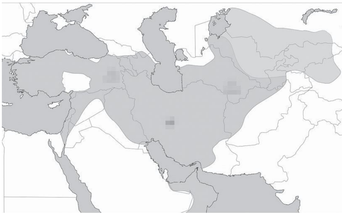
Сельджукская империя в пору своего расцвета

В правление Малик-шаха (1072–1092), сына и преемника Алп-Арслана, сельджукское государство достигло своего расцвета. Его восточная граница доходила до Памирских гор, а западная – до Босфора и Дарданелл. Но после смерти Малик-шаха великая империя начала распадаться на части.