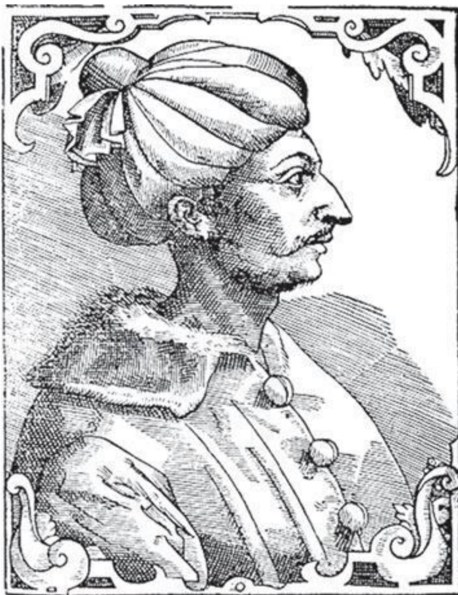
Таким представлял в XVI веке Орхана Гази итальянский ученый Паоло Джовио

Сын Осман-бея Орхан, тоже получивший почетный титул борца за веру – Гази, такими достоинствами обладал. Орхан был не тенью своего отца, а опытным полководцем и зрелым мужем. Точная дата рождения Орхана неизвестна, но предположительно он появился на свет в 1280–1282 годы. Следовательно, на момент смерти отца ему было около сорока лет. Орхан продолжил дело, начатое отцом, и стал вторым из трех основателей Османской империи (третьим считается сын Орхана Мурад).