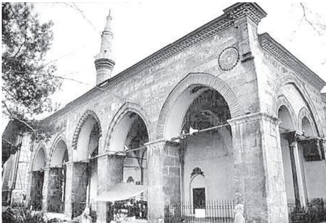
Комплекс мечети Орханийе в Бурсе, построенный в 1339–1340 годах

Орхана вполне заслуженно можно было бы назвать не Орханом Гази, а Орханом Строителем, потому что он не только завоевывал города, но и много в них строил, причем строил с размахом. К Бурсе Орхан относился с трепетной заботой. Ему хотелось превратить свою столицу во второй Багдад, сделать ее сердцем мусульманского мира. Здесь была основана духовная академия, в которую приезжали учиться из дальних краев, например из Персии.