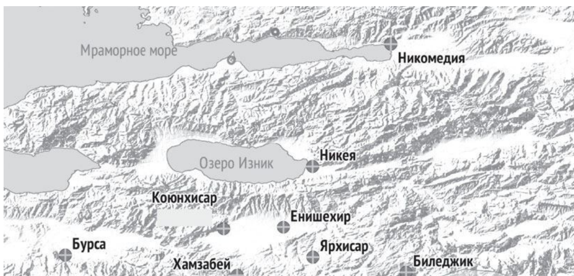
Место Бафейской битвы (отмечено красным кружком)

Осман-бей охотно принимал под свои знамена всех желающих, и его войско состояло из представителей нескольких бейликов. По византийским данным, в нем было пять тысяч сабель. У обедневших к тому времени византийских императоров осталось мало регулярного войска. Из экономии они предпочитали не содержать большое войско, а платить наемникам, когда в тех возникает необходимость, или же набирать на время ополчение из гражданского населения. Поэтому армия Георгия Музалона была похожа на кокореч 34 – она состояла из византийских солдат, наёмников-аланов 35 и ополченцев. Многие наемники и ополченцы разбежались, и перед сражением у Музалона осталось около двух тысяч воинов.