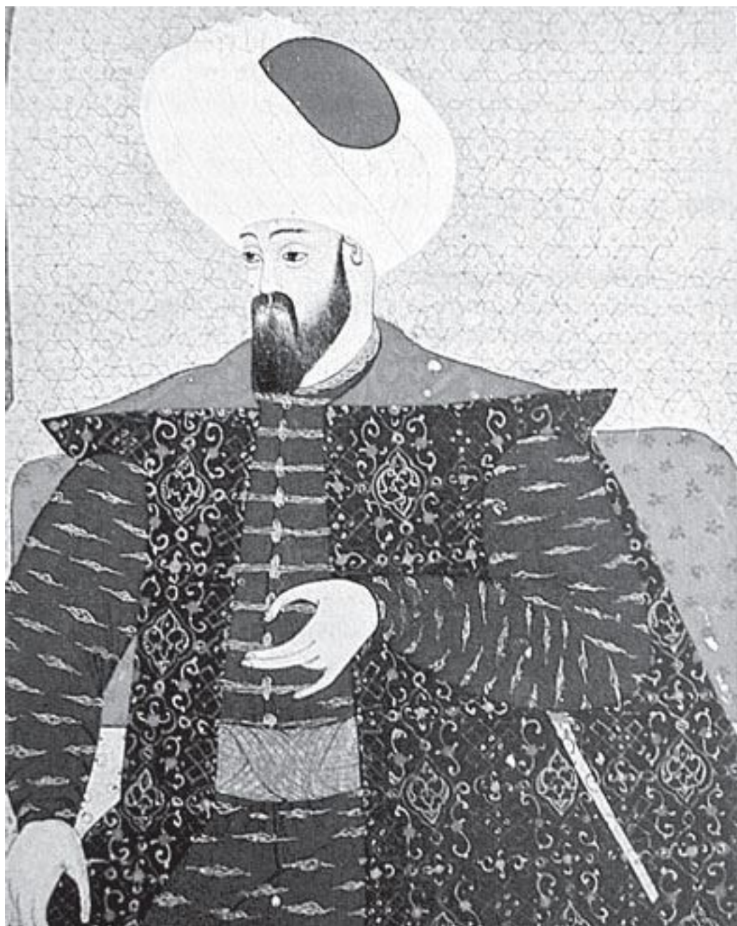
Таким представляли Османа Гази в XVI веке

Попросите любого турецкого школьника рассказать вам об Османе Гази, и он будет рассказывать до тех пор, пока вы не устанете слушать. О своих соседях турки, наверное, знают меньше, чем о доблестном основателе государства. После стопятидесятисерийного сериала о Эторгул-бее стали снимать такую же обстоятельную сагу о его сыне... Но если мы обратимся к историческим документам и начнем придирчиво искать хроники, составленные при жизни Османа Гази, то мы не найдем ничего. Совсем ничего. Все хроники, рассказывающие о правлении отца-основателя появились гораздо позже и являются не чем иным, как пересказом легенд по принципу: «Об этом поведал мне один почтенный дервиш...» Стилизованных под старину фальшивок тоже предостаточно, но объективных свидетельств очевидцев не существует. И наиболее известный портрет Османа Гази, который наивные люди принимают за прижизненное изображение, на самом деле является миниатюрой из исторического трактата XVI века.