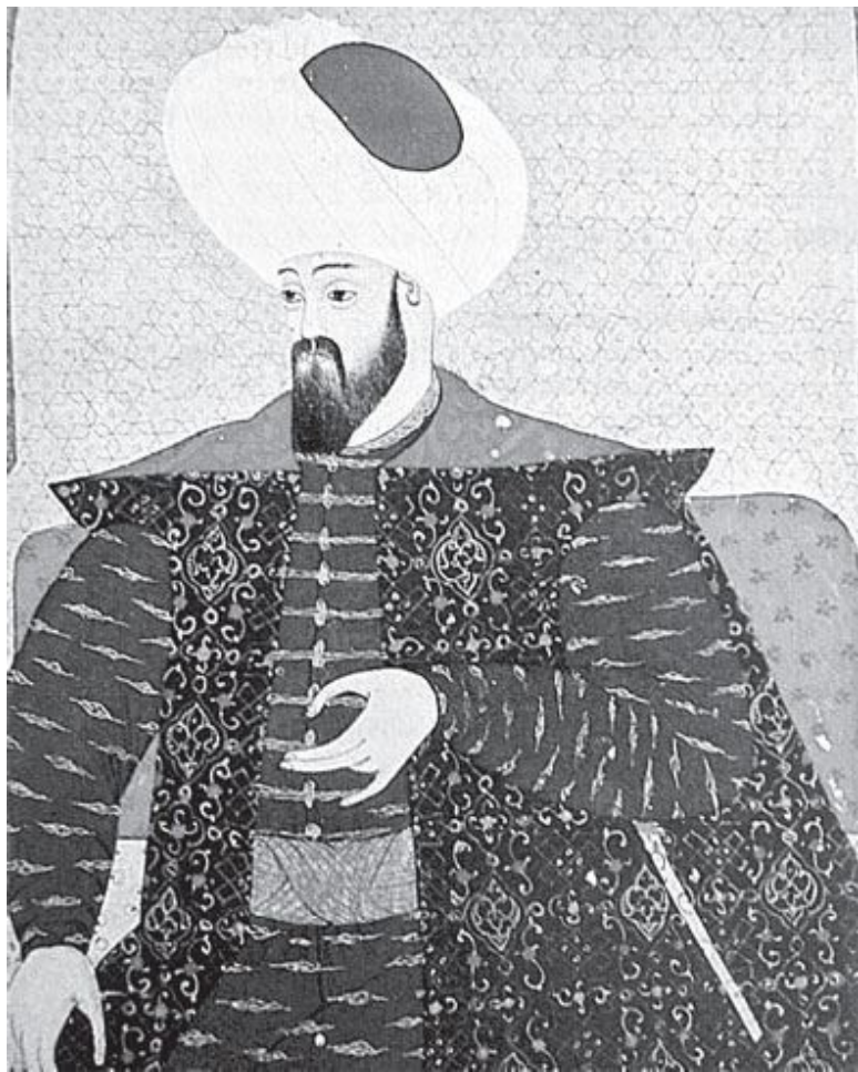
Таким представляли Османа Гази в XVI веке