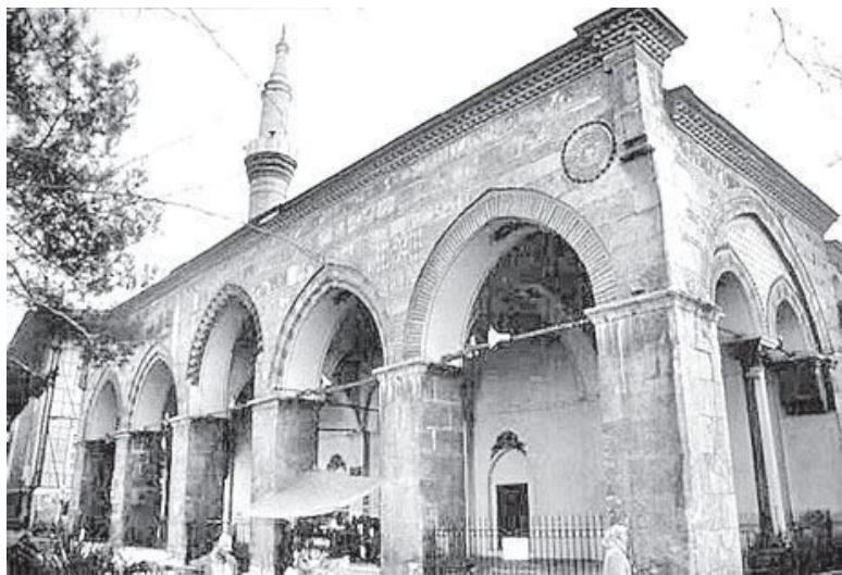
Комплекс мечети Орханий в Бурсе, построенный в 1339–1340 годах

ханом Гази, а Орханом Строителем, потому что он не только завоевывал города, но и много в них строил, причем строил с размахом. К Бурсе Орхан относился с трепетной заботой. Ему хотелось превратить свою столицу во второй Багдад, сделать ее сердцем мусульманского мира. Здесь была основана духовная академия, в которую приезжали учиться из дальних краев, например из Персии.