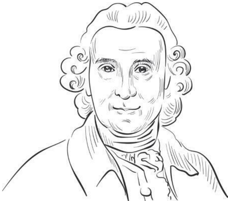
Рис. 4. Джеймс Линд

Линд опубликовал результаты своего исследования, однако, несмотря на это, адмиралтейство не добавило свежие цитрусы в диету моряков, и еще многие годы врачи применяли для лечения бесполезные препараты. В те времена в качестве доказательств эффективности лекарств принимали рассказы о чудесном лечении, которые распространяли те, кому становилось лучше. Пусть и не от лечения, а от того, что мо-