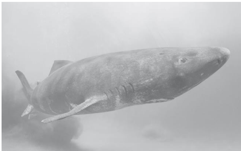
Рис. 9. Гренландская акула [121]

Гренландская полярная акула (рис. 9) – холоднокровная рыба, которая обитает в водах Северной Атлантики, максимальная зарегистрированная длина представителя этого вида составляет 6,4 м [119, 120].