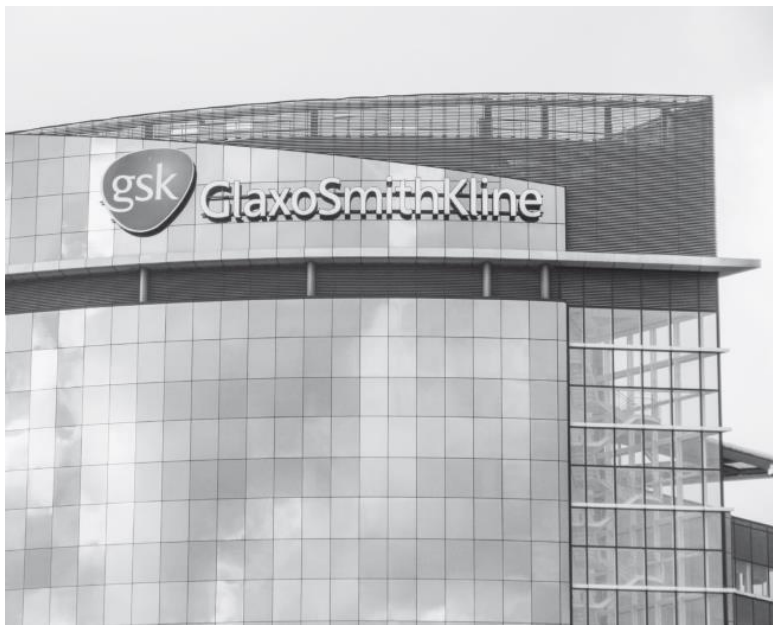
Рис. 1. Здание фармгиганта GlaxoSmithKline, Лондон, 2 февраля 2012 [3]

Несмотря на множество необоснованных заявлений, Дэвид Синклер пользуется авторитетом у многих. Люди читают его книги, верят словам, не требуя доказательств. Да и зачем они нужны, когда правда может оказаться так же непривлекательна, как старая, сморщенная карга из книги Роберта Томпкинса. И вот уже почти у каждого начинающего долгожителя в шкафу заводится классика великого заблуждения