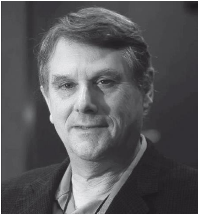
Рис. 7. Гордон Гайатт [88].

Термин «доказательная медицина» ввел в 1990 году Гордон Гайатт (рис. 7) из Университета Макмастера [89]. До-