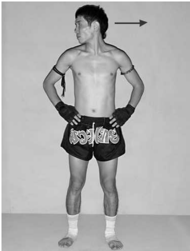
Фото 1. Поворот головы влево