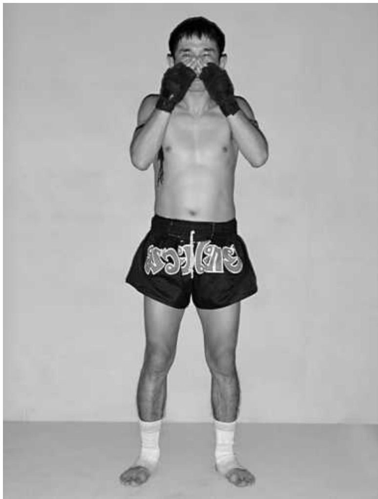
Фото 6. Массаж области носа