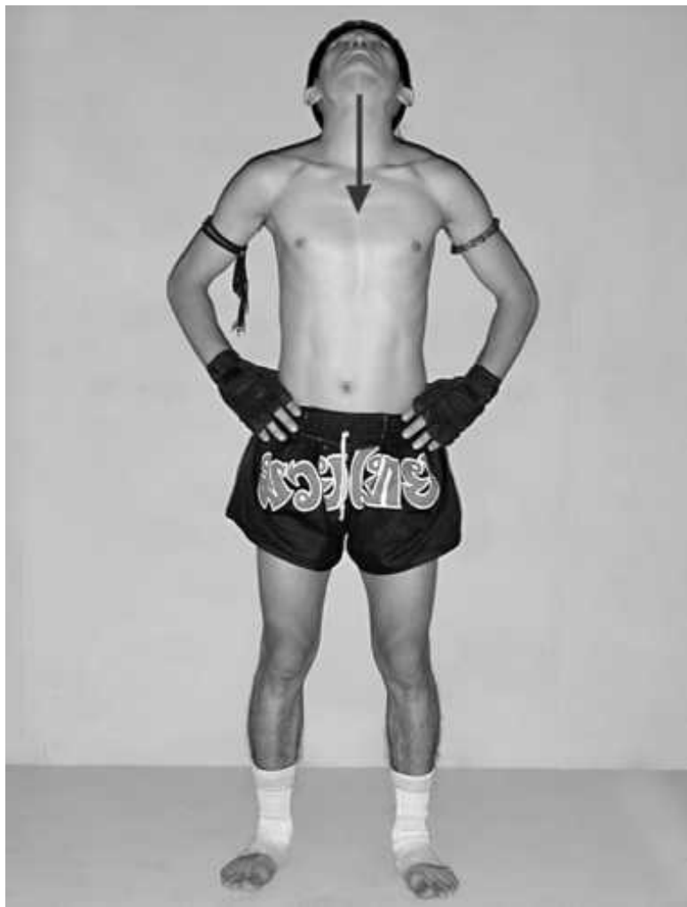
Фото 3. Наклон головы назад