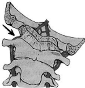
Рис. 1. Сужение или полное сдавление одной из позвоночных артерий в месте сгибания сосудисто-нервного пучка позвоночной артерии задней поверхности тела первого шейного позвонка при повороте головы в противоположную сторону

Сужение позвоночной артерии наступает в результате внедрения сосудистой стенки в просвет артерии. Сужение или закупорка может быть постоянной или временной в зависимости от вида патологии (угол отхождения от подключичной артерии, патологическая извитость на уровне шейно-затылочного сочленения, сдавление межпозвонковой грыжей) и условий, в которых возникает или усиливается нарушение проходимости позвоночных артерий, например, при изменении положения головы.