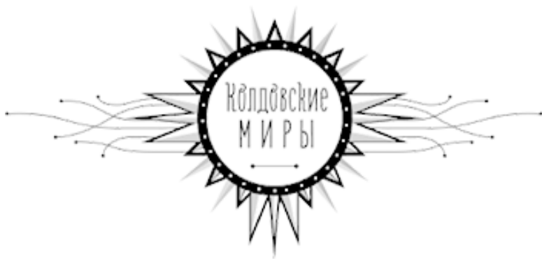
Иллюстрация на переплете Л. Сова

Разработка серийного оформления О. Закис