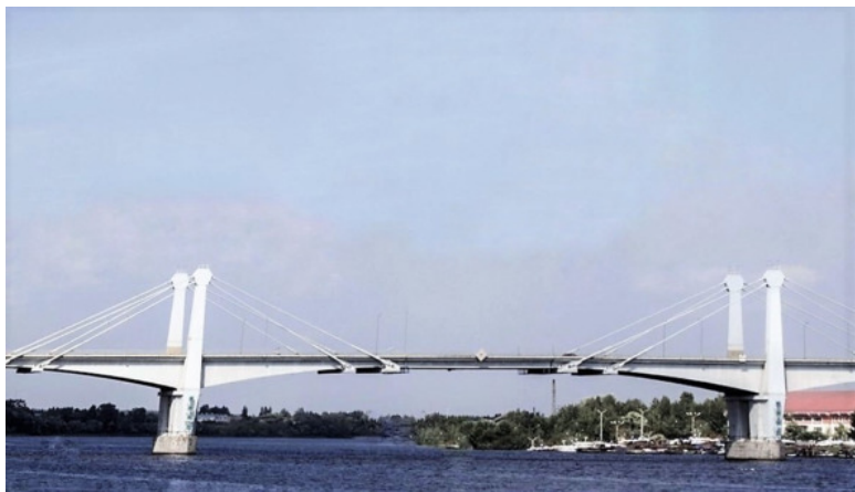
Кимры: автомобильный мост