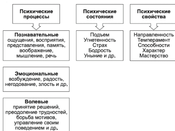
Рис. 1. Структура психических явлений

Необходимо отметить, что существуют различные точки зрения на структуру психических явлений. Однако наиболее часто встречается деление психических явлений на три основных класса: психические процессы, психические состояния и психические свойства личности (рис. 1).