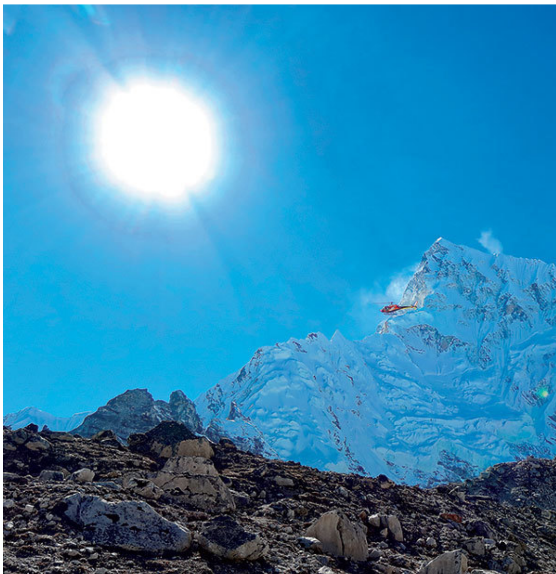
Катманду: ворота Непала