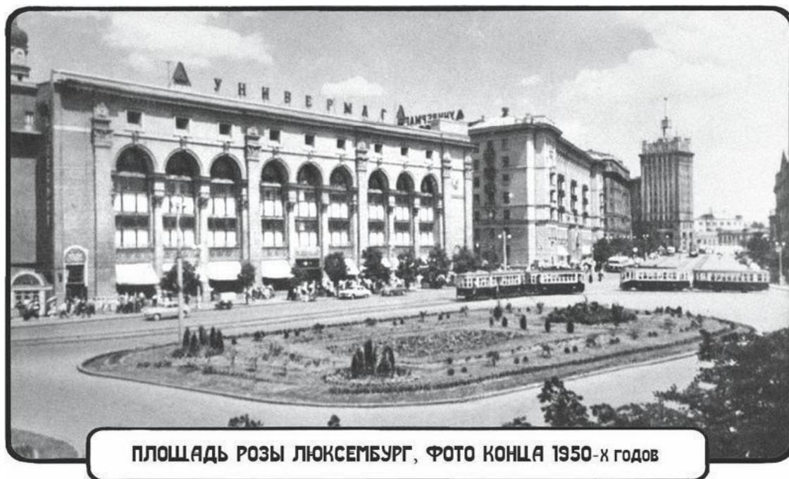
ПЛОЩАДЬ РОЗЫ ЛЮКСЕМБУРГ, ФОТО КОНЦА 1950-х годов