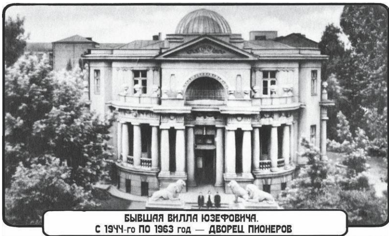
БЫВШАЯ ВИЛЛА ЮЗЕФОВИЧА. С 1944-го по 1963 год — ДВОРЕЦ ПИОНЕРОВ

– Ну ты, мать, даешь! – выслушивала примерно в то же время на собственной кухне Галина Воскресенская-Морская. – 30 лет в обед! Солидный возраст, а все еще веришь в чудеса!