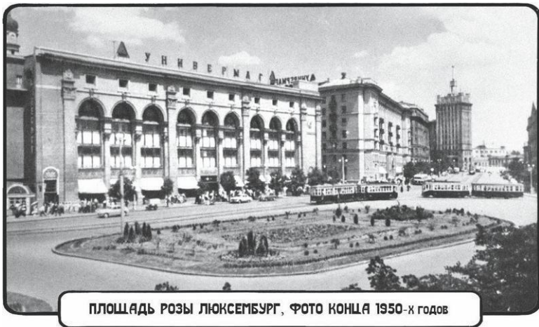
ПЛОЩАДЬ РОЗЫ ЛЮКСЕМБУРГ, ФОТО КОНЦА 1950-х годов

Попытка поговорить с бывшей женой обернулась для Морского очередной нелепостью. Неудивительно – с Ириной все всегда было непросто. Накрученный увещеваниями Галочки о совести и удачно подвернувшейся «просьбой» Николая, Морской все же решил навеститься к гражданке Грох с соболезнованиями.