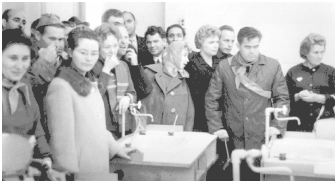
Космонавты и жены Ю. Гагарина и В. Комарова в жилой комнате пионерлагеря.