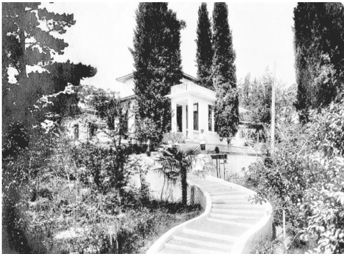
Дом-музей Николая Островского в Сочи. Здание построено в дар писателю Правительством Украинской ССР