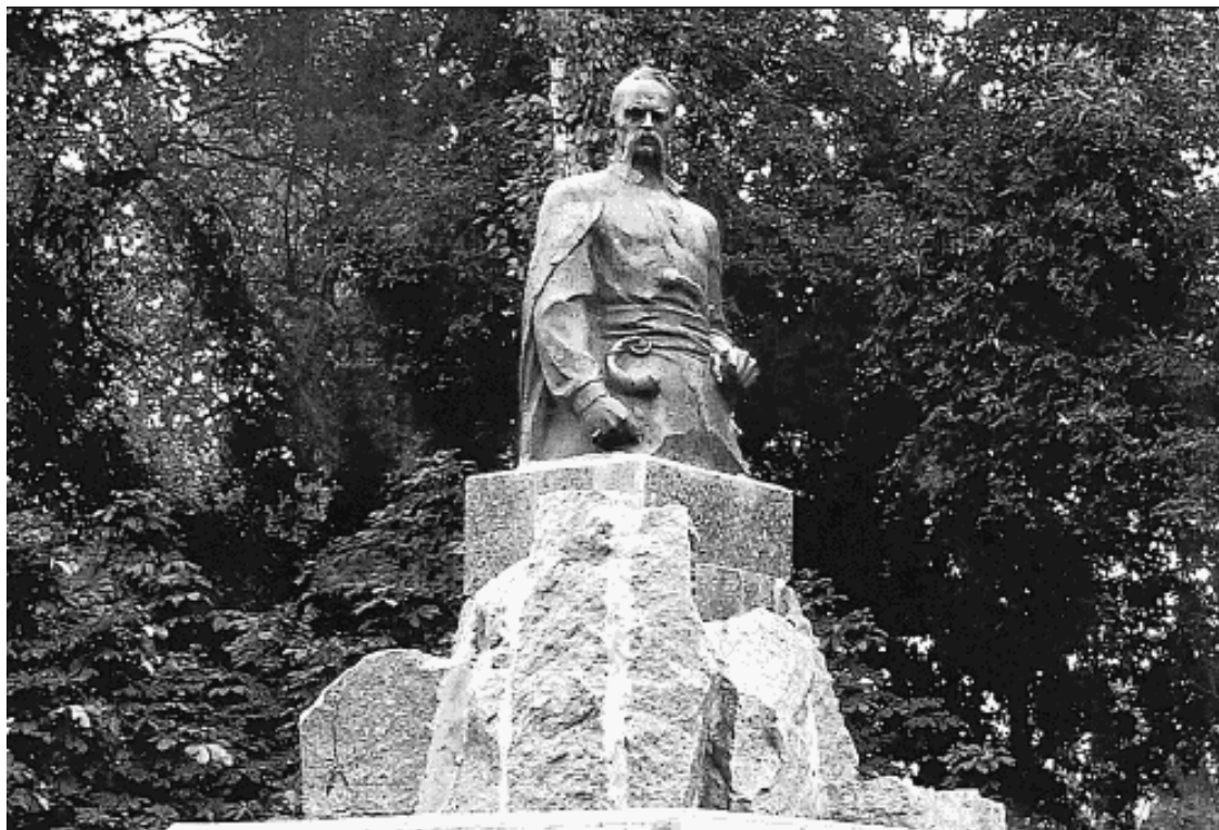
Памятник основателю города Ивану Барвинку.