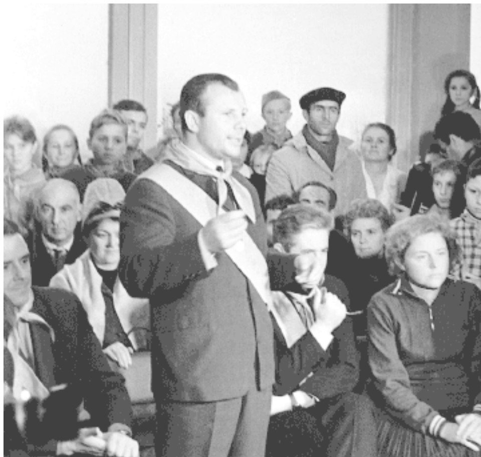
Выступает Юрий Алексеевич Гагарин.