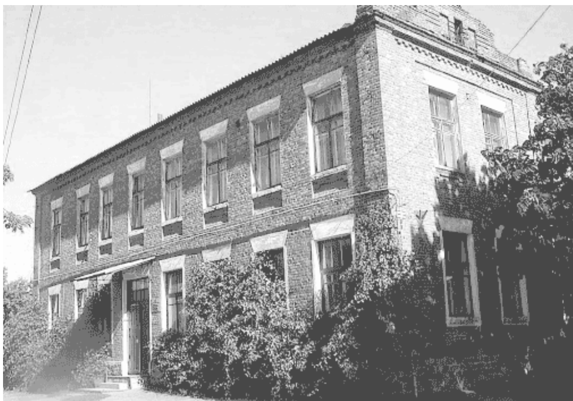
Здание бывшей семилетней школы № 2, которую автор книги окончил в июне 1941 года.