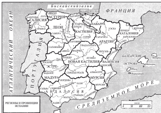
Карта 2. Регионы и провинции Испании

Когда начали поступать их результаты, стало ясно, что во всех крупных городах Испании кандидаты, поддерживавшие монархию, потерпели сокрушительное поражение. В таких городах, как Мадрид и Барселона, за республиканцев было отдано подавляющее большинство голосов. Но всем было хорошо известно, что в сельских местностях касики еще обладают достаточным влиянием, чтобы не допустить честного голосования 6 . Вечером следующего за выборами дня на улицах Мадрида стали собираться огромные толпы. Самые близкие друзья короля посоветовали ему незамедлительно покинуть столицу, чтобы предотвратить кровопролитие. Помедлив, Альфонс с достоинством оповестил: «Воскресные выборы доказали, что я больше не пользуюсь любовью своего народа. Я мог бы очень легко найти средства для все-