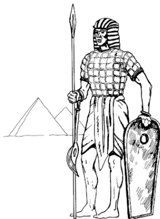
Египетский пеший воин

Ко времени Троянской войны (начало 2-го тысячелетия до н. э.) народы Египетского и Месопотамского царств обладали уже куда более высоким искусством войны, чем их соседи с севера и запада. Шумеры после столетий междоусобных войн, казалось, объединились в империю только затем, чтобы около 2750 года до н. э. попасть под власть аккадского завоевателя Саргона I. Аккадско-шумерская империя вскоре была окружена эламитами с востока и амореями с запада. Последние же, основавшие или занявшие тогда еще малоизвестный город на Евфрате, называвшийся Вавилоном, уже позднее, при Хаммурапи I, завоевали большую часть территории Междуречья. Таким образом, к 2100 году до н. э. регион этот, каким бы малым он ни казался нам сейчас, уже был обильно полит кровью. А несколько позднее по нему уже текли реки крови.