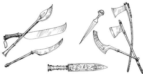
Египетские меч, боевые топоры и кинжалы

Древние египтяне занимали географическое положение, благоприятствовавшее развитию их цивилизации в обстановке мира и покоя. Защищенная морями и пустынями, страна была открыта для вторжения со стороны государств Двуречья только через узкий перешеек Суэца и испытывала лишь общие для всех цивилизаций проблемы. Верхний и Нижний Египет, поглотив многие мелкие царства, были объединены под властью одного фараона. Мена, или Менее, считающийся основателем первой из тридцати одной династии, правивших Египтом вплоть до завоевания страны Александром Македонским в 332 году н. э., царствовал около 4000 года до н. э. Его преемники и те правители из последующих династий в период так называемого Древнего царства, кто смог укрепить царскую власть, воздвигли большую часть знаменитых пирамид.