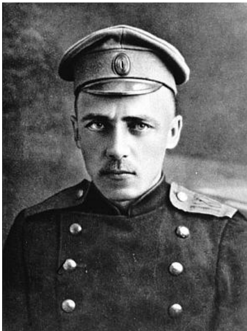
В. Хлебников в армии

Замахивались же футуристы на большее. По сути, они метили на то, чтобы стать официальным искусством. Единственным. В этом нет ничего ни нового, ни необычного. Все к этому стремятся. Только не все признаются. Как ни крути, государство – самый лучший заказчик. Пикассо, к примеру, тоже неоднократно заявлял, что был бы очень рад, если бы его произведения пропагандировались «сверху». Да что далеко ходить! Вспомним недавнюю нашу «демократическую творческую интеллигенцию», которая после разговоров о «свободе» начала отчаянную борьбу с конкурентами – писателями с национал-патриотическими взглядами – за государственную поддержку. В Петербурге они ее не получили только потому, что на выборах первого губернатора поставили не на того кандидата.