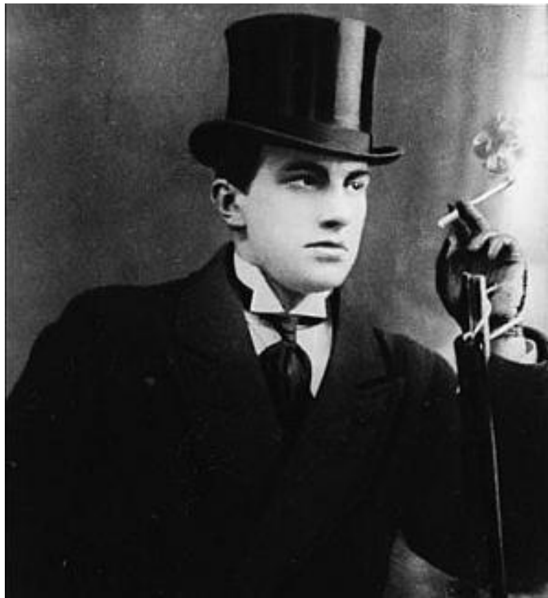
В. Маяковский. 1916 г.

два пальца и разражался оглушительным свистом. Эту манеру впоследствии позаимствовал у него Сергей Есенин.