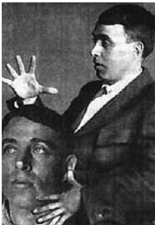
А. Крученых. Коллаж

А первым до такого на наших просторах додумался человек, которого звали Давид Бурлюк. Вообще-то он считался художником и поэтом. Но рисовал он, прямо скажем, так себе – имелись тогда и среди крайних авангардистов художники куда сильнее. По сравнению со своими товарищами по футуристической борьбе – Филоновым или Кандинским – его просто не разглядеть. Поэтом он являлся и вовсе никаким. Тем не менее Бурлюк был гениальным человеком. Гениальным продюсером. Он первым осознал основной закон раскрутки – не важно, что о тебе пишут. Главное – чтобы писали как можно чаще! Сегодня это положение кажется общим местом. Но до всего кто-то додумывается впервые. И колесо когда-то было новинкой. В том-то и состоит гениальность, что человек открывает новые горизонты.