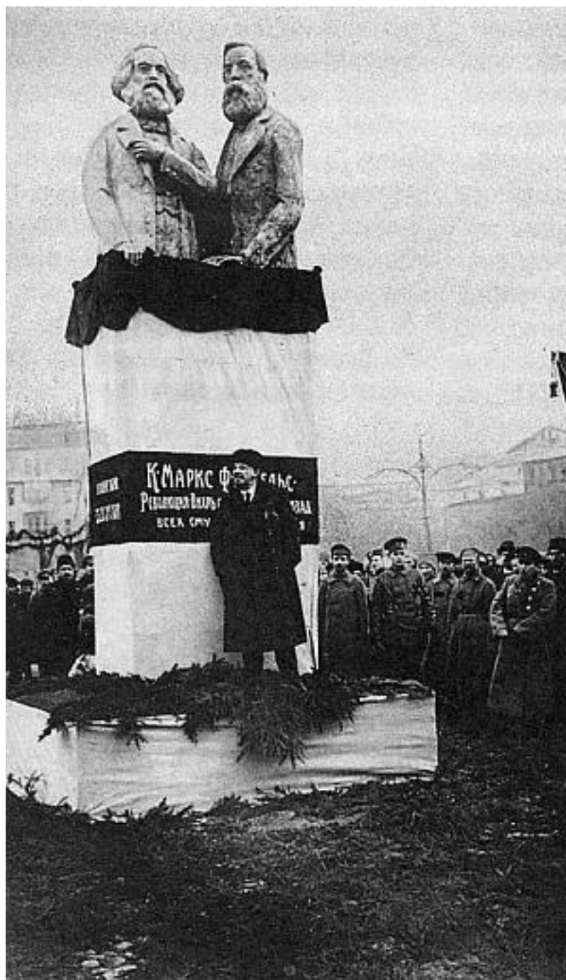
Ленин выступает на открытии гипсового памятника К. Марксу и Ф. Энгельсу. 1918 г.

Более всего отличились художники и скульпторы. Так, к примеру, знаменитый Татлин к годовщине Октября раскрасил из пульверизатора деревья на Красной площади в красный цвет. Ничего так смотрелось, наверное. Но это было только начало.