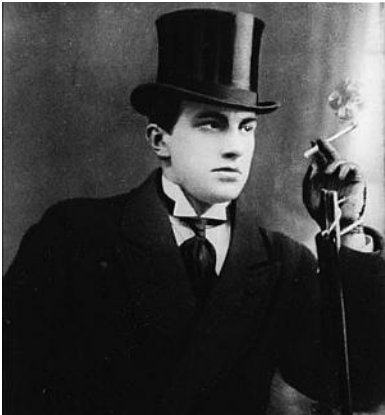
В. Маяковский. 1916 г.

Надо сказать, что собственно на стихи футуристов тогда никто особого внимания не обращал. Да и какой-то творческий багаж был разве что у Каменского и Хлебникова. Пер-