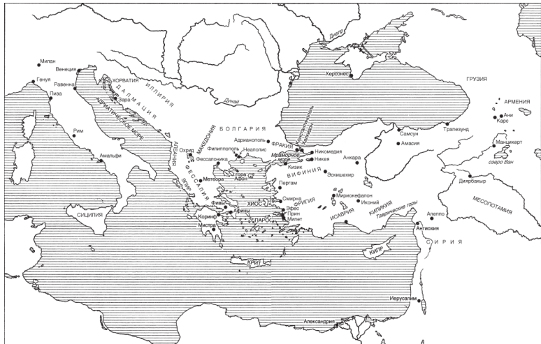
Рис. 1. Византийский мир.