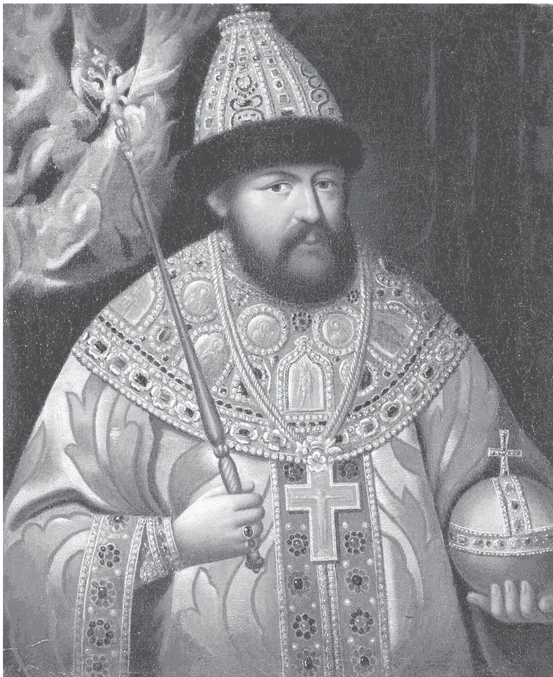
Царь Алексей Михайлович

Обварного меда взять всемеро больше свежего, чуть теплой водой разбавить, да мед процедить ситом начисто, чтоб не осталось воску, да положить в тот мед по полумере хмелю на каждый пуд раствора. А при варке того меда пену снимать ситом, чтоб было в котле чисто, когда же уварится мед вполовину, его из котла долой, остудить чуть-чуть, да сложить мед в мерник чисто, опять без воску, да краюшку хлеба натереть дрожжами с патокой и запечь в печи, да положить тот мед в мерник и заквасить. А как станет мед сильно скисать, тотчас сливать его в бочки, чтобы не перекис».