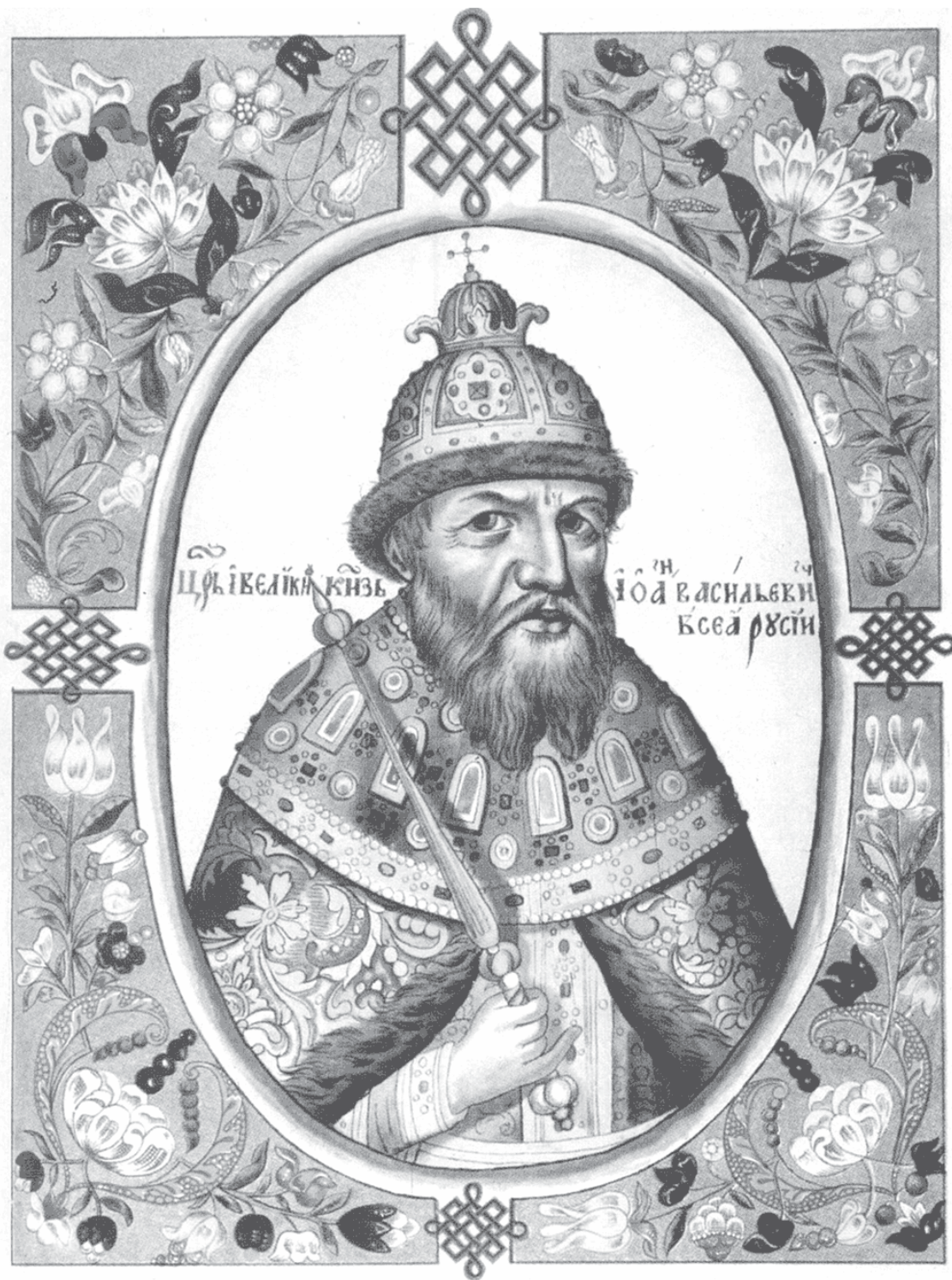
Царь Иван IV

И это, в общем-то, несколько странно, если иметь в виду, что Иван Грозный был одним из самых образованных людей того времени, много читал, и не только церковную литературу. У него накопилась большая библиотека, ее поиски продолжают и по сей день. Так что на досуге он развлекал себя не только кровавыми зрелищами, но и тихой охотой за знаниями, а также игрой в карты, шашки и шахматы. Тот же Горсей утверждал, что царь и умер за шахматной доской.